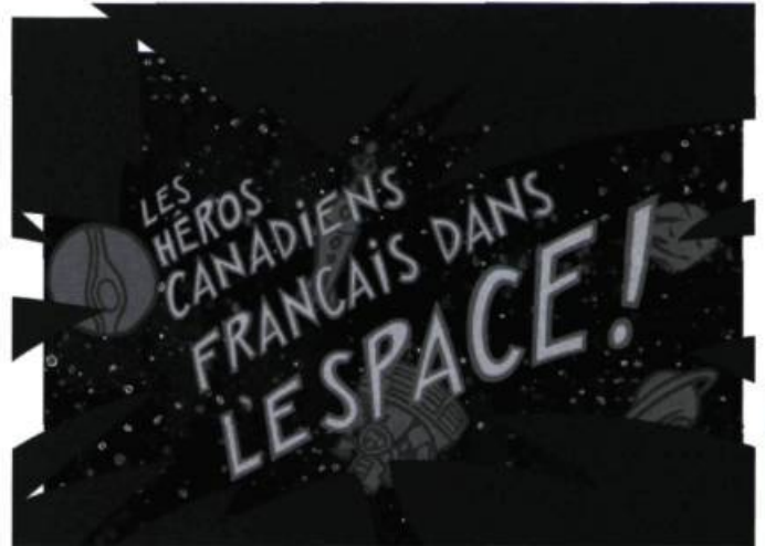
Les Héros canadiens-français dans l'espace d'Alex Roy