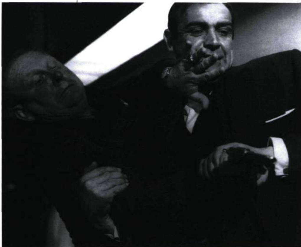
Sean Connery en pleine action dans Goldfinger

voiture de luxe Aston Martin DB-5. Ces véhicules modifiés ont même parfois préfiguré de véritables innovations comme le téléphone, l'écran télévisuel et le système de récepteur Global Positioning System (GPS) que l'on trouve dans les voitures d'aujourd'hui. Avec ses goûts démesurés pour les plaisirs de la vie, ses voitures extravagantes, sa tenue soignée et ses compagnes ravissantes, il n'est pas étonnant que ses antagonistes le reconnaissent immédiatement. En fait, James Bond est l'agent le moins secret de