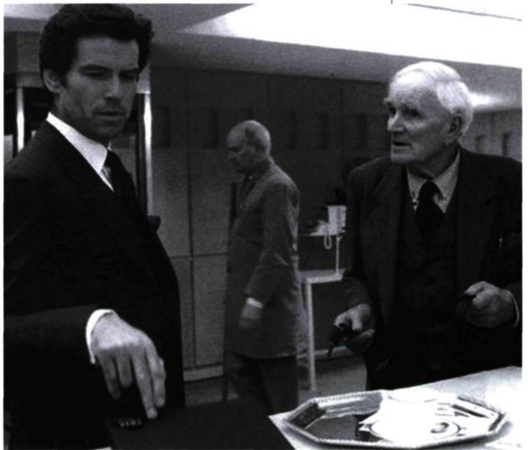
Pierce Brosnan, le dernier James Bond en titre

Cinq acteurs (au cinéma) en quête d'un seul personnage, James Bond est l'un de ces rares héros qui ne vieillit jamais et dont les aventures fascinent de génération en génération. Les autres héros de cette trempe, Tarzan, Superman et Batman appartiennent au monde de la bande dessinée. Bond, comme Sherlock Holmes, n'est pas doué de pouvoirs spéciaux, il enquête, déjoue et vainc ses ennemis grâce à son savoir-faire et à son intelligence (aidé parfois de quelques gadgets il est vrai...). Il est l'archétype de l'étranger qui, à la manière du samouraï Toshirô Mifune dans le film Yojimbo (1961) d'Akira Kurosawa, agit au vu et au su de ses ennemis et quitte le village lorsque le mal est vaincu. Ce qui amuse dans chaque nouveau film de la série 007, ce n'est pas forcément l'intrigue qui est toujours la même; c'est le contexte socioculturel, les lieux et les personnages qu'il nous fait découvrir. Quoi que nous réserve l'avenir, il est réconfortant de savoir que Bond sera toujours là pour nous sauver, ne serait-ce que dans nos fantasmes... ■