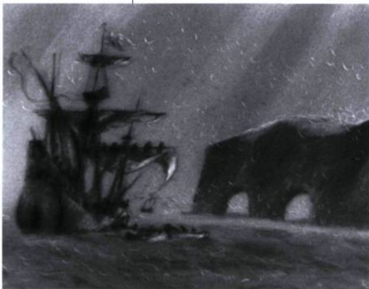
Le Fleuve aux grandes eaux (1983)

Frédéric Back: Il voulait faire un guide sur Montréal dont j'ai fait les peintures.