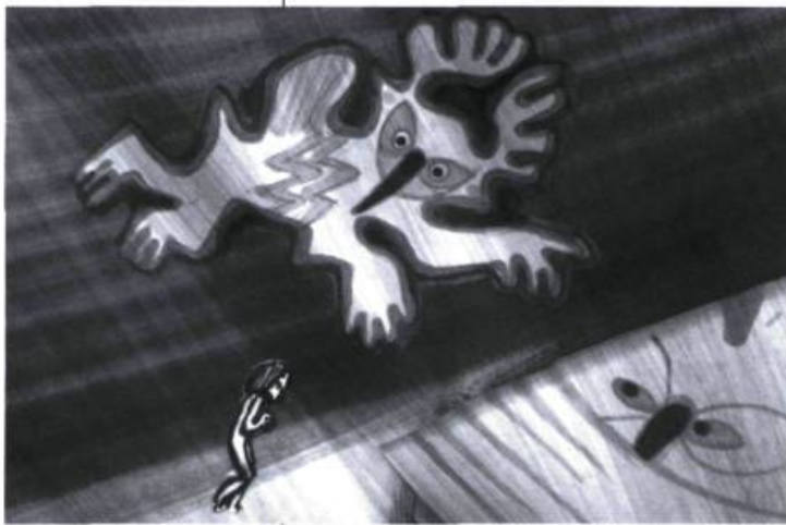
Inon ou la conquête du feu (1972)

Ghylaine Paquin-Back: C'était, pour nous, une conséquence logique.