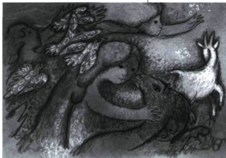
Tout rien (1979 -)

Frédéric Back: Tout juste une semaine. J'y étais allé auparavant, mais sans penser à cela. Mais il n'y avait pas intérêt à insister sur le caractère provençal du sujet. Le sujet était universel.