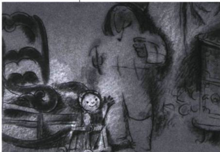
Crac! (1981)

Ciné-Bulles: Ce que l'on peut décrire aujourd'hui comme votre vision, votre message vous semblaient déjà très clair à vos débuts?