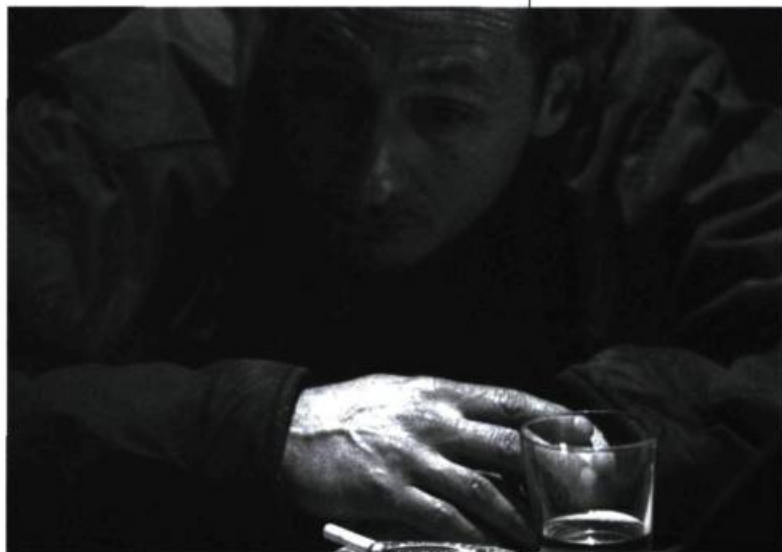
20 h 17, rue Darling «emprunte au polar sa trame de fond, la fausse enquête, qui sert de prétexte au voyage intérieur de Gérard.»

Il plane sur 20 h 17, rue Darling un déterminisme et un pessimisme qui motivent l'atmosphère du film noir, présente dans la palette sombre et les nombreuses scènes nocturnes. Homme du peuple,