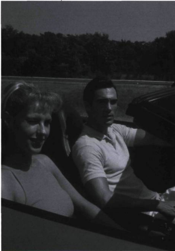
Dans Québec-Montréal , «Barbie et Ken représentent les archétypes de la beauté, de la jeunesse et de l'idéal amoureux.»

Québec-Montréal se veut ici une forme de commentaire critique sur le cycle amoureux qui évolue en cinq temps (l'idéal, la quête, la passion, la quotidienneté et la rupture). Plutôt parodique, la trame sert également de métaphore à l'impossible quête sentimentale des personnages en cavale. Dans leur luxueuse voiture sport rouge, par exemple, Barbie et Ken représentent les archétypes de la beauté, de la jeunesse et de l'idéal amoureux. Ce modèle reflète bien les critères esthétiques qui sont véhiculés par les vedettes du cinéma populaire. Barbie et Ken, idoles des fillettes, illustrent un symbole tout à fait ironique du couple idéal. La parodie des personnages et des situations tragico-comiques sert ici à faire émerger le regard critique du cinéaste et à qualifier le ton road movie .