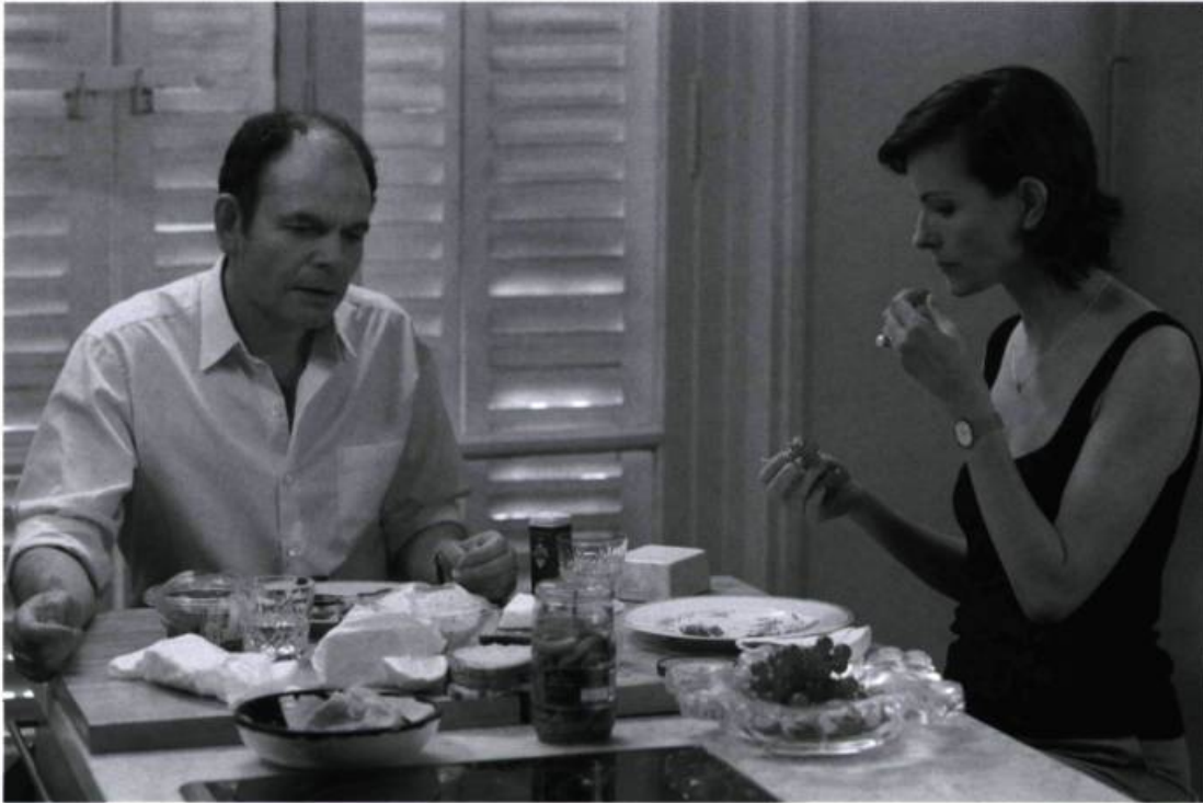
Jean-Pierre Darroussin et Carole Bouquet dans Feux rouges. Pour le moment, le couple est au beau fixe...

agents littéraires zélés; les problèmes d'alcool de Simenon; etc., cet opuscule acquiert une toute autre aura : celle d'une œuvre aux effluves toutes personnelles qui recèle sa part d'ombre.