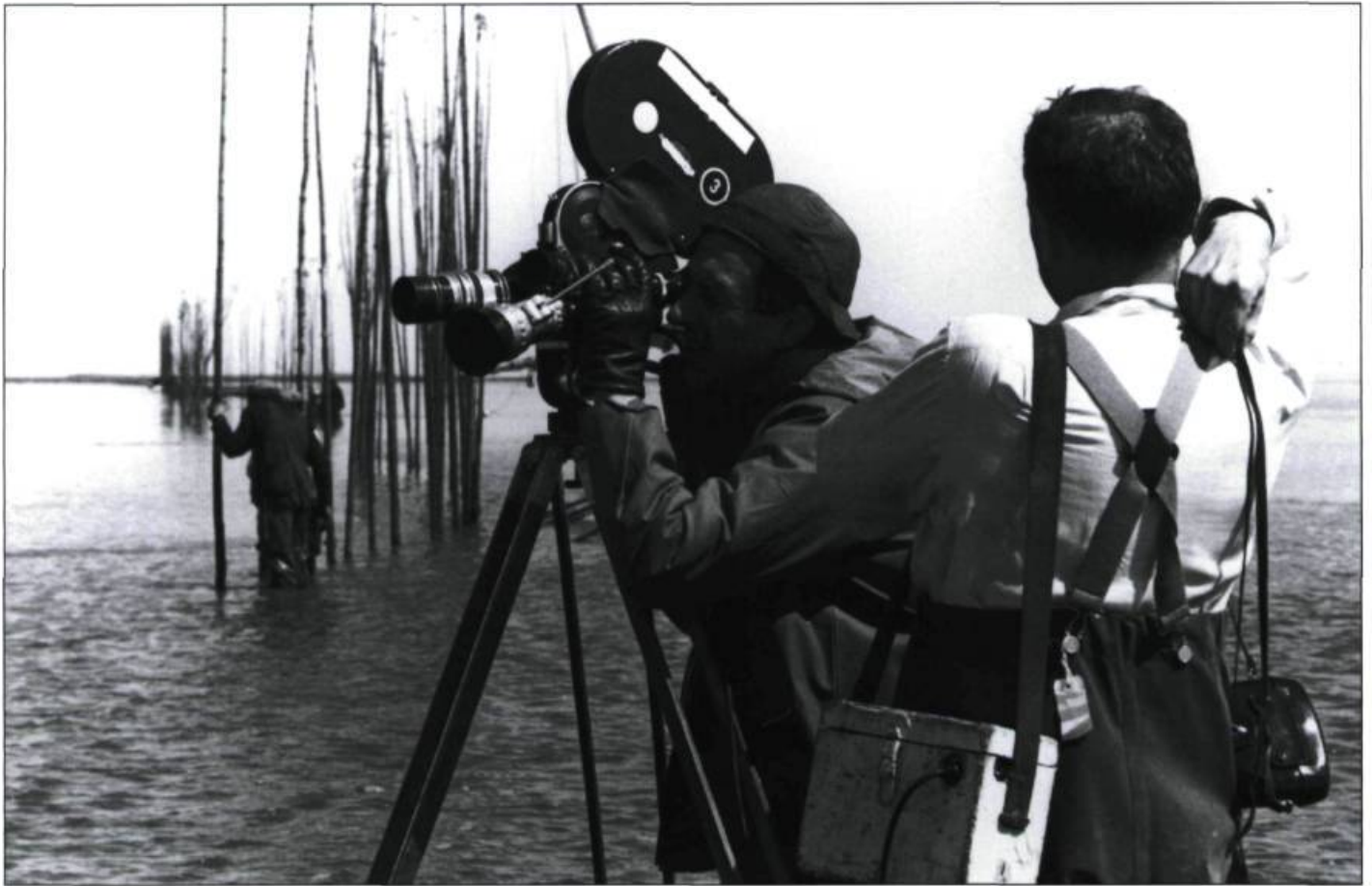
Michel Brault et Pierre Perrault sur le tournage de Pour la suite du monde en 1962

faisait dans Entre la mer et l'eau douce , Michel Brault concentre son film sur l'expérience de quelques personnes « ordinaires » qui, par leur force de représentation, parviennent à évoquer les sentiments et les perceptions d'une vaste majorité de Québécois. Avec Les Ordres , Brault réaffirme ses penchants nationalistes qui avaient déjà teinté son œuvre (Michel Brault avait signé d'autres films ouvertement engagés comme le documentaire L'Acadie l'Acadie!?!? sur la grève étudiante à l'Université de Moncton).