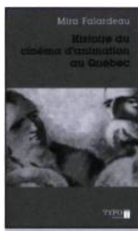
FALARDEAU, Mira. Histoire du cinéma d'animation au Québec , Montréal, Typo Essai, 2006, 187 p.

Cela dit, si l'on considère la vitalité actuelle du cinéma québécois et les transformations qu'il pourrait subir dans un futur rapproché en raison d'une intensification des productions grand public ou d'un retour à un cinéma plus personnel, budget restreint oblige, force est de remarquer que l'ouvrage de Michel Coulombe risque d'être un instrument en perpétuelle mutation. Cela n'étant pas dit pour décourager l'homme. ■