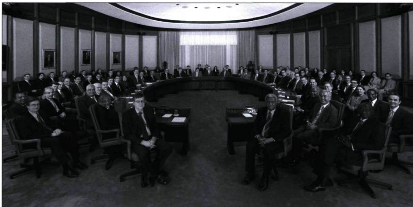
Conseil des directeurs du Fonds monétaire international (FMI)

Oui. Fournir un bagage qui contribue à le former. Ce que le système d'éducation fait de moins en moins... ■