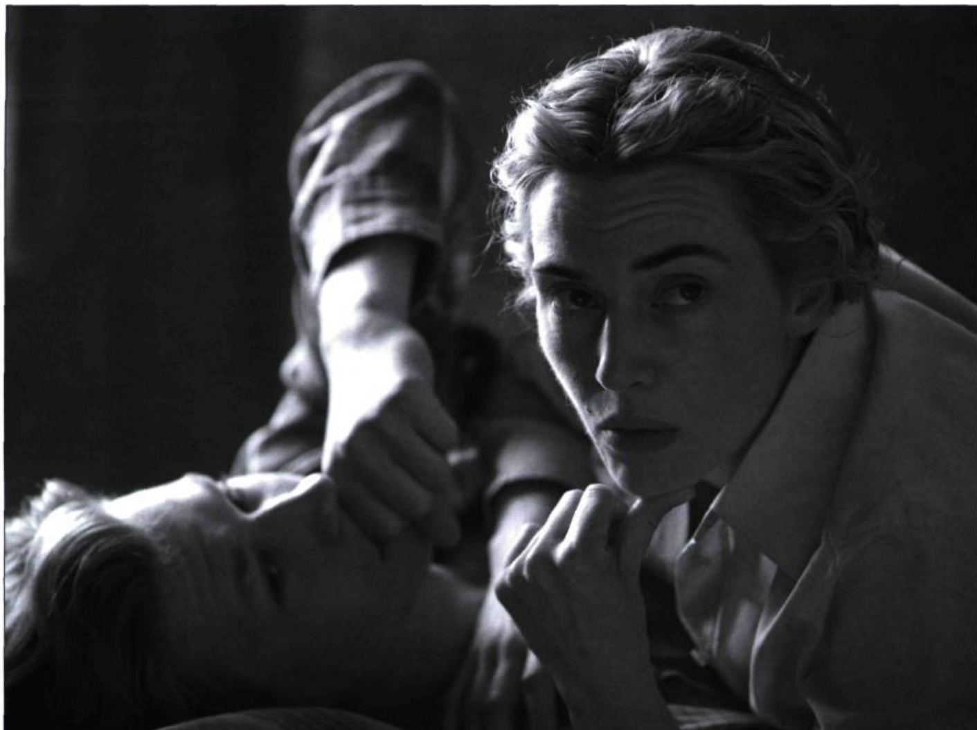
The Reader de Stephen Daldry

la gardienne Schmitz : « Lorsque vous avez été en contact avec elle ces dernières années, avez-vous jamais eu le sentiment qu'elle savait ce qu'elle vous avait fait? » Michaël ne peut que hausser les épaules, avec le doute ultime et lourd de sens : « Ai-je compté pour cette femme qui aura occupé toute ma vie? » Si les toutes dernières phrases ne sont pas aussi équivoques que dans le roman, Hanna peut encore espérer, où qu'elle soit, l'absolution.