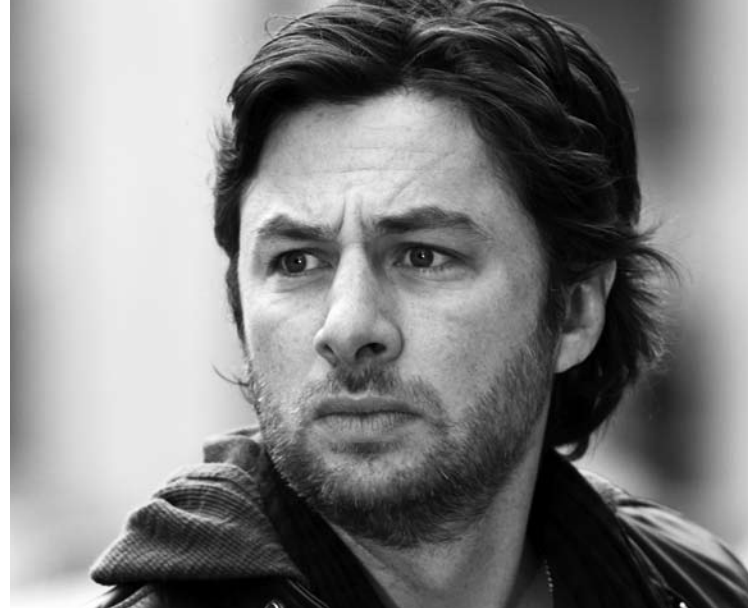
Zach Braff

les acteurs: nous ne pouvions pas refaire une scène plus de deux ou trois fois.