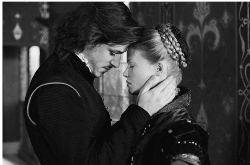
Henri de Guise (Gaspard Ulliel) et Marie de Montpensier (Mélodie Thiery)

hommes et des dieux de Xavier Beauvois), mais sans fausse note, offrant un visage marqué par le temps à la sagesse de son personnage. Sur ces traits, on devine ses failles. Masculin d'un côté, anguleux, puissant et révélateur des forces tourmentées qui l'assaille. Infiniment fin de l'autre, preuve de sa belle sensibilité, de son courage et de sa subtilité. Pour autant, il n'est pas aussi féminin que Raphaël Personnaz, au regard pénétrant, qui souligne une personnalité contrastée, nuancée et tout en clairs-obscurs. Tavernier le représente avec tact et respect, dans toute sa délicatesse, mais sans emphase. Duc d'Anjou et futur Henri III, qui aimait tant s'apprêter, se laver, s'opposer à la guerre, il fut taxé d'homosexualité, réduit aux raccourcis faciles entre féminité et préciosité. L'acteur, mais surtout le regard que porte sur lui Tavernier, force l'admiration. Tout est dit, en attitudes et en gestes, tout le meilleur dont il était capable (aimer, sans réserve), tout le pire également (ses colères, orageuses!).