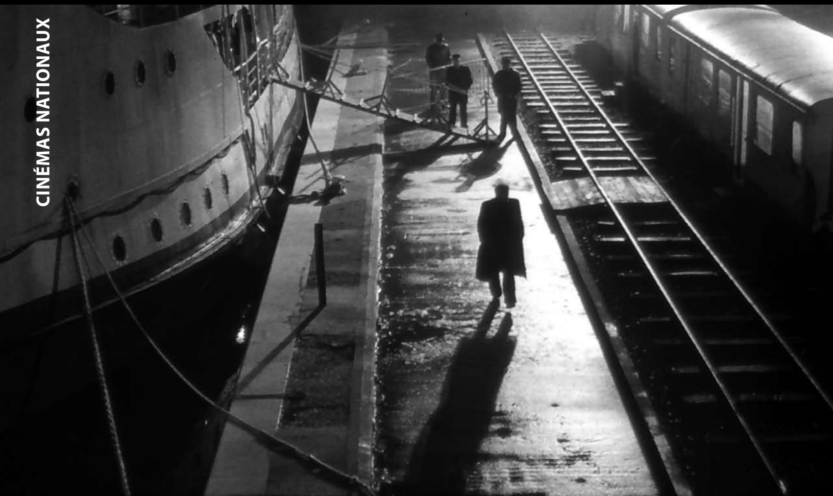
L'Homme de Londres de Béla Tarr