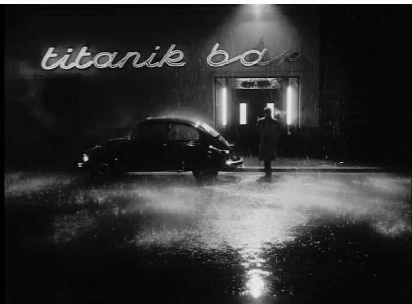
Damnation et Les Harmonies de Werckmeister de Béla Tarr