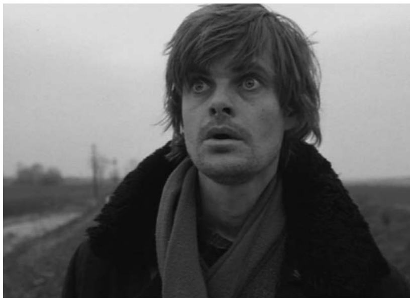
Damnation et Les Harmonies de Werckmeister de Béla Tarr

aussi d'un soutien affectif et familial. Comme le film de Makk, Adoption est un film de femmes. Des femmes qui souhaitent quitter leur solitude et trouver le bonheur — l'ouvrière le trouvera auprès d'un enfant, tandis que l'adolescente le cherchera auprès d'un mari. La filmographie de Mészáros, plus encore que celle de Karr, est un brillant exemple de la puissance et de la vitalité du cinéma d'auteur hongrois des années 1960-1970.