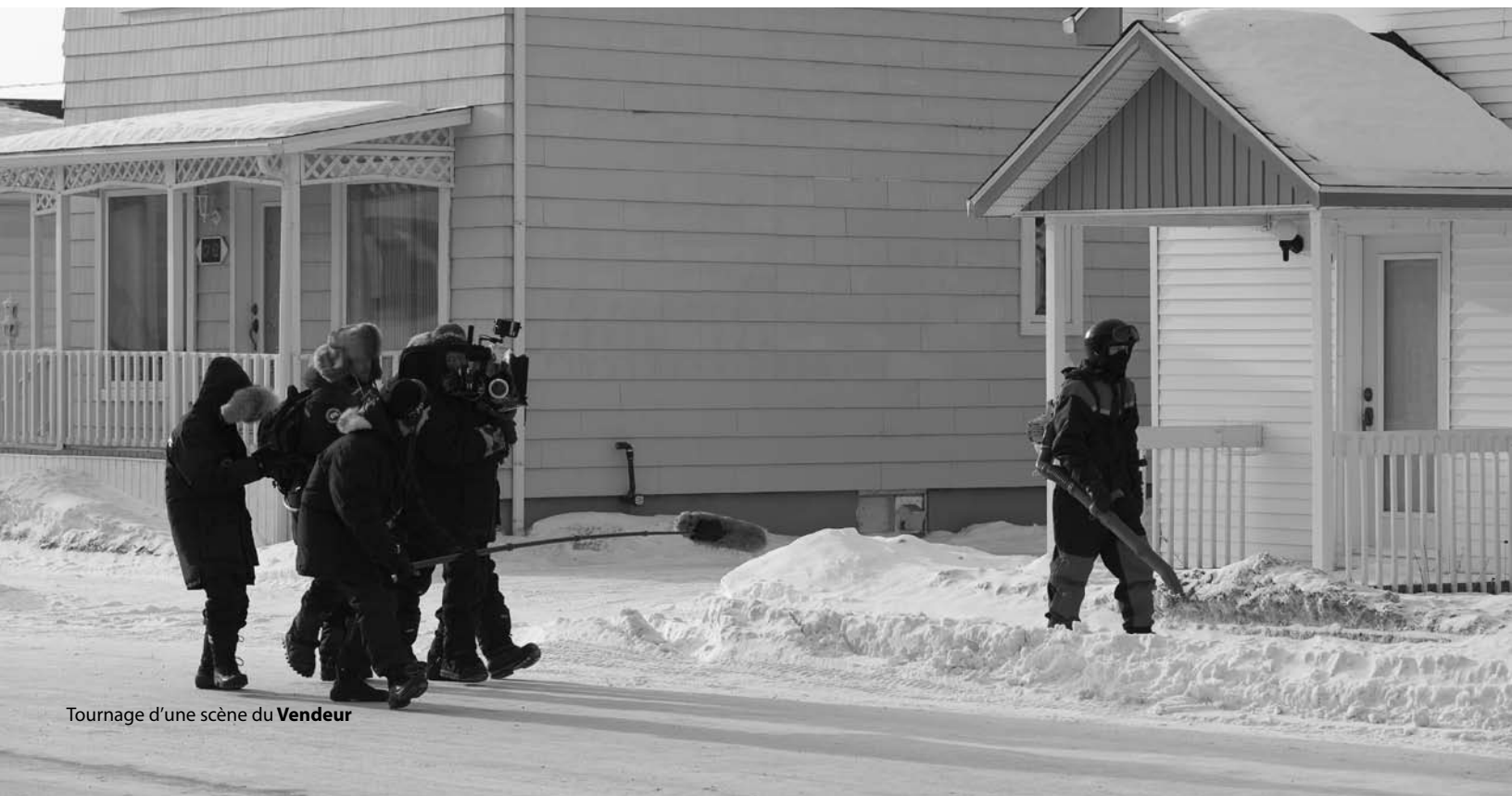
Tournage d'une scène du Vendeur

Quand on tourne en région éloignée, les gens sont contents de montrer leur maison, leur tracteur, leur camion. Il y a un phénomène Grande Séduction . J'ai certaines appréhensions parce que le film n'est pas joyeux. Les gens de la région sont contents, ils me remercient et cela me touche, mais je ne veux pas me mettre trop de responsabilité sur les épaules.