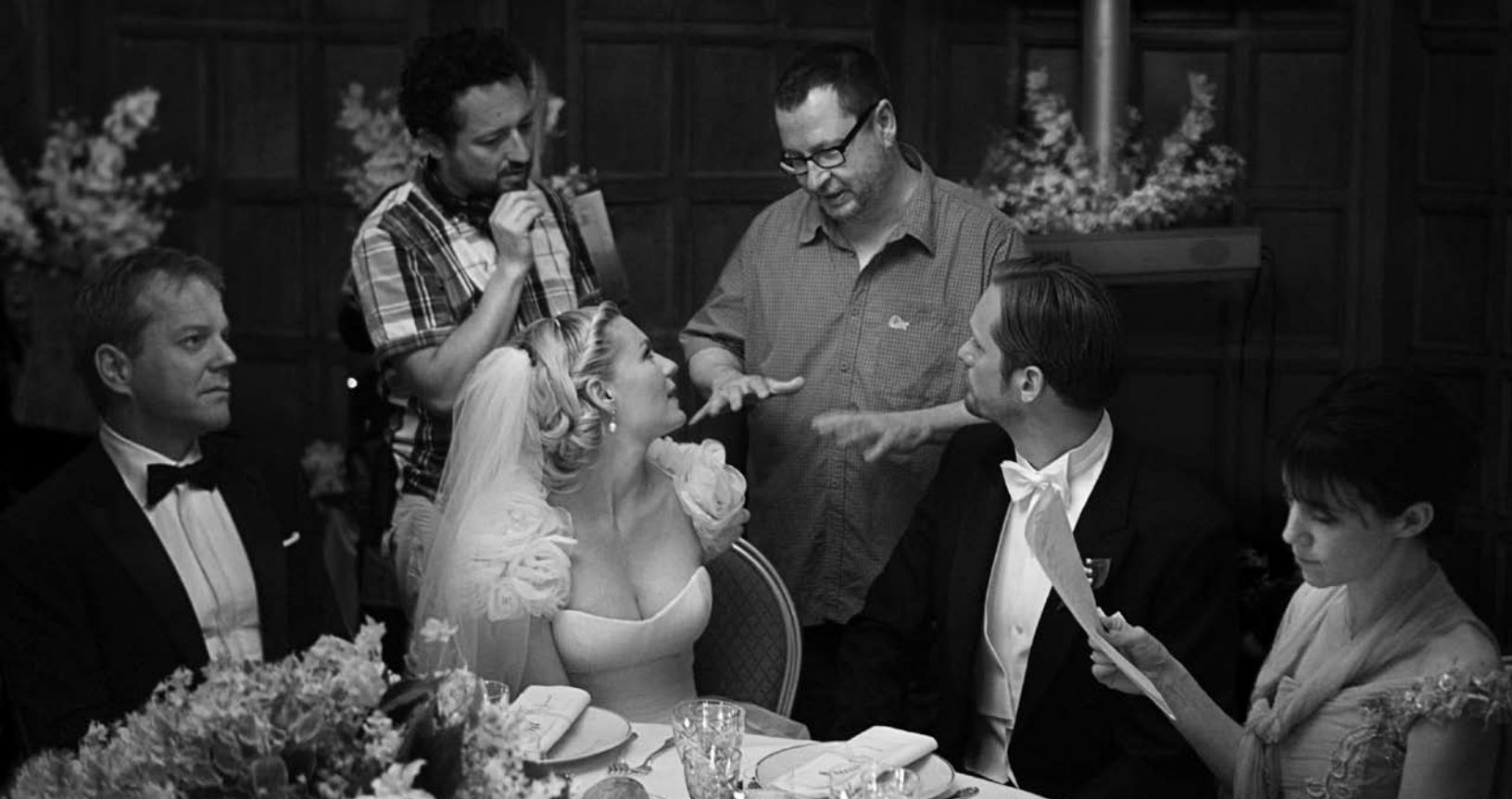
Lars von Trier discutant avec ses comédiens lors du tournage de Melancholia : Kiefer Sutherland, Kirsten Dunst, Alexander Skarsgard et Charlotte Gainsbourg

Trier y demeure attaché; son œuvre, depuis la fin des années 1990, en porte la trace, bien que s'éloignant de plusieurs règles instaurées par le Dogme. Ce qui reste intact chez le cinéaste danois, c'est l'approche cinéma-direct : une caméra mobile presque toujours à l'épaule, qui capte le mouvement des personnages comme à l'improviste, avec des zooms ou des panoramiques vifs. La première partie de Melancholia , par exemple, rappelle jusqu'à un certain point, à travers cette longue scène de mariage qui laisse découvrir des comportements et des prises de parole inaccoutumés, la réunion de famille complètement déjantée du Festen (1998) de Vinterberg, premier film officiel du Dogme.