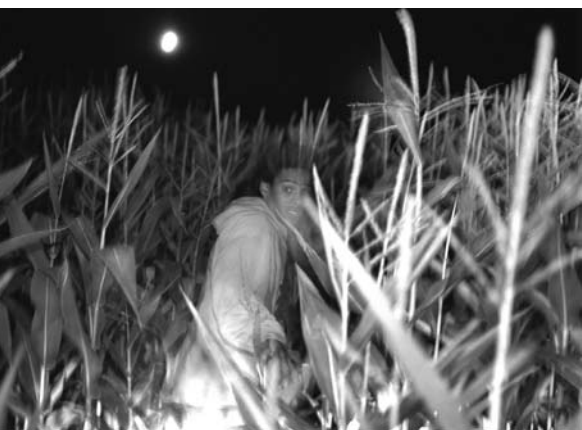
Le Nèg' de Robert Morin

deux nouveaux auteurs. L'arrivée de Marie-Anne Raulet a permis d'alléger la tâche de Lorraine Dufour qui combinait les rôles de productrice exécutive et d'ad-