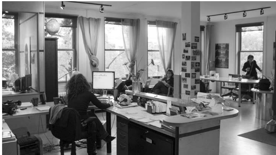
Les bureaux de la Coop Vidéo sur le Plateau-Mont-Royal à Montréal

Il règne au sein de la compagnie un esprit propice à la création. Pour plusieurs des membres, la Coop Vidéo est une entité qui favorise le travail collectif, mais c'est aussi un lieu où l'amitié est très présente. « La force de la Coop, c'est qu'on n'est pas tout seul, on vient ici et l'on peut jaser de nos projets, on peut