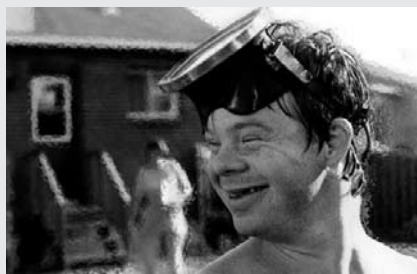
Tristesse modèle réduit