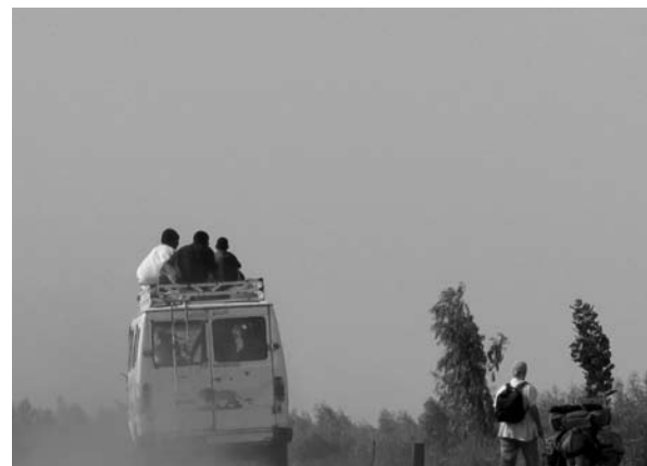
Carnet d'un détour de Catherine Hébert