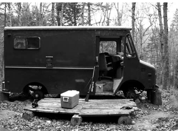
Panache d'André-Line Beauparlant