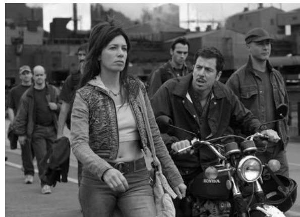
Délivrez-moi de Denis Chouinard