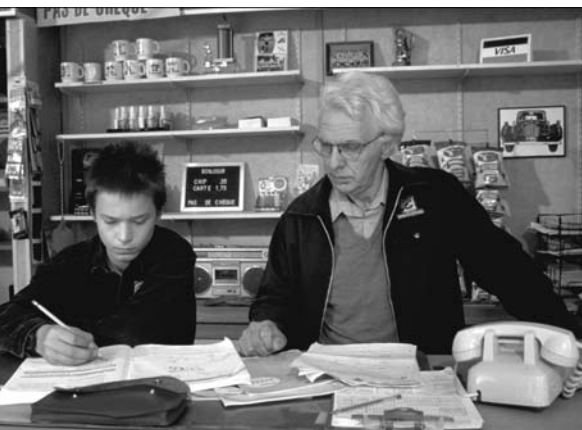
Gaz Bar Blues de Louis Bélanger

œuvres de ses membres. Comme les films sont regroupés chez un seul et même producteur, il est facile de les rassembler en vue d'une rétrospective ou