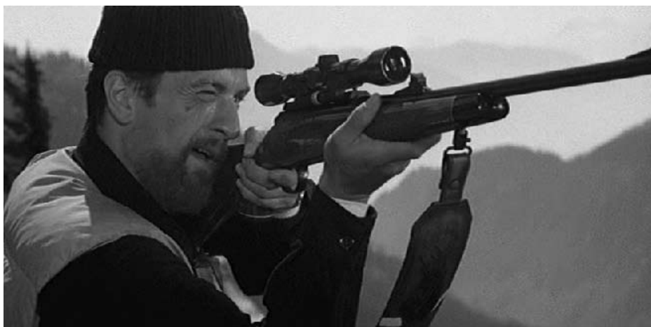
The Thin Red Line, Paths of Glory et The Deer Hunter

Le personnage de Witt ne cesse de relier la vanité des combats et leur déroulement dans la jungle de Guadalcanal. « Qu'est-ce que cette guerre au sein même de la nature? », dit-il en début de récit. L'homme s'est éloigné du jardin idyllique des origines par son désir de savoir, de connaître. La pensée rationnelle l'a poussé vers une modernité dont la pire tare fut la fabrication d'armes meurtrières. Malick est à la recherche d'une paix intérieure qui trouverait racines dans des lieux non violés par l'homme. Il cherche une forme d'harmonie, par l'entremise d'un contact avec ses origines. Le rousseauisme la nomme solution antimilitariste.