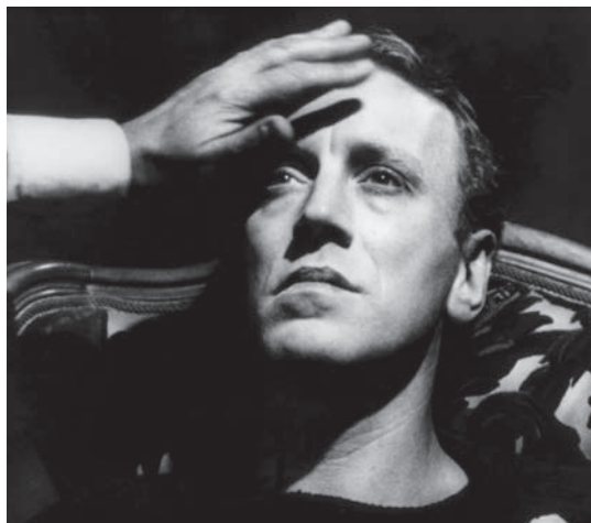
L'Heure du loup

La manipulation est le propre du cinéma. Par le montage, les plus grands cinéastes ont toujours su déjouer avec brio les attentes des spectateurs, provoquant non seulement la surprise, mais aussi l'angoisse. Peur de l'irrationnel, inconfort devant la mort, l'angoisse n'a cessé de nourrir la cinématographie sous toutes ses formes, à commencer par les films d'épouvante et autres thrillers psychologiques. Voici cinq longs métrages parmi les plus pertinents de ce vaste champ d'études.