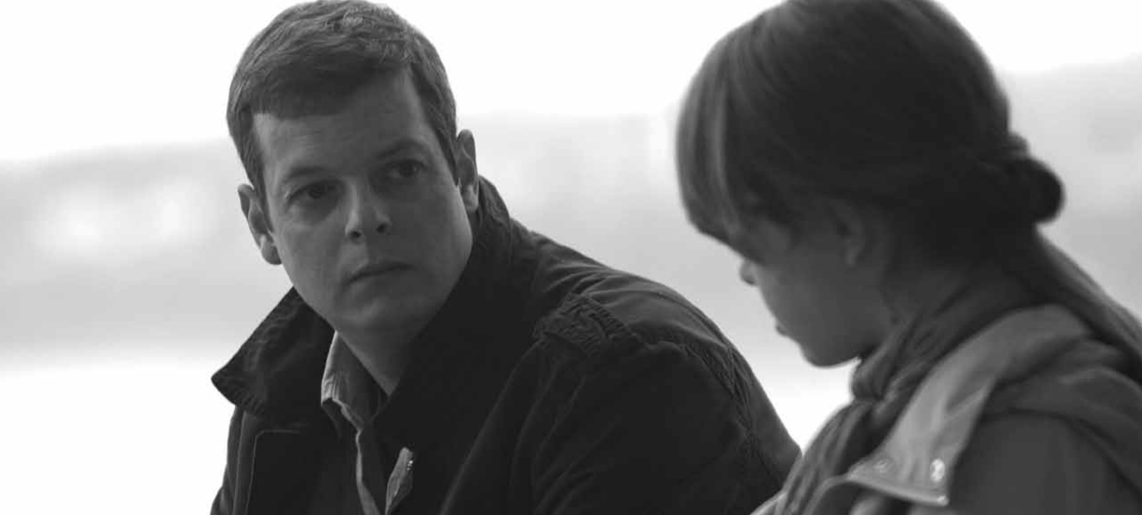
Rencontre entre un père et sa fille

pour gagner leur vie en essayant quelque chose de radicalement différent. C'est une autre sorte d'exigence. Toutefois, je ne peux faire autrement que d'admirer leur performance à la télé. Tourner 30 pages par jour pour une série, c'est de calibre olympique!