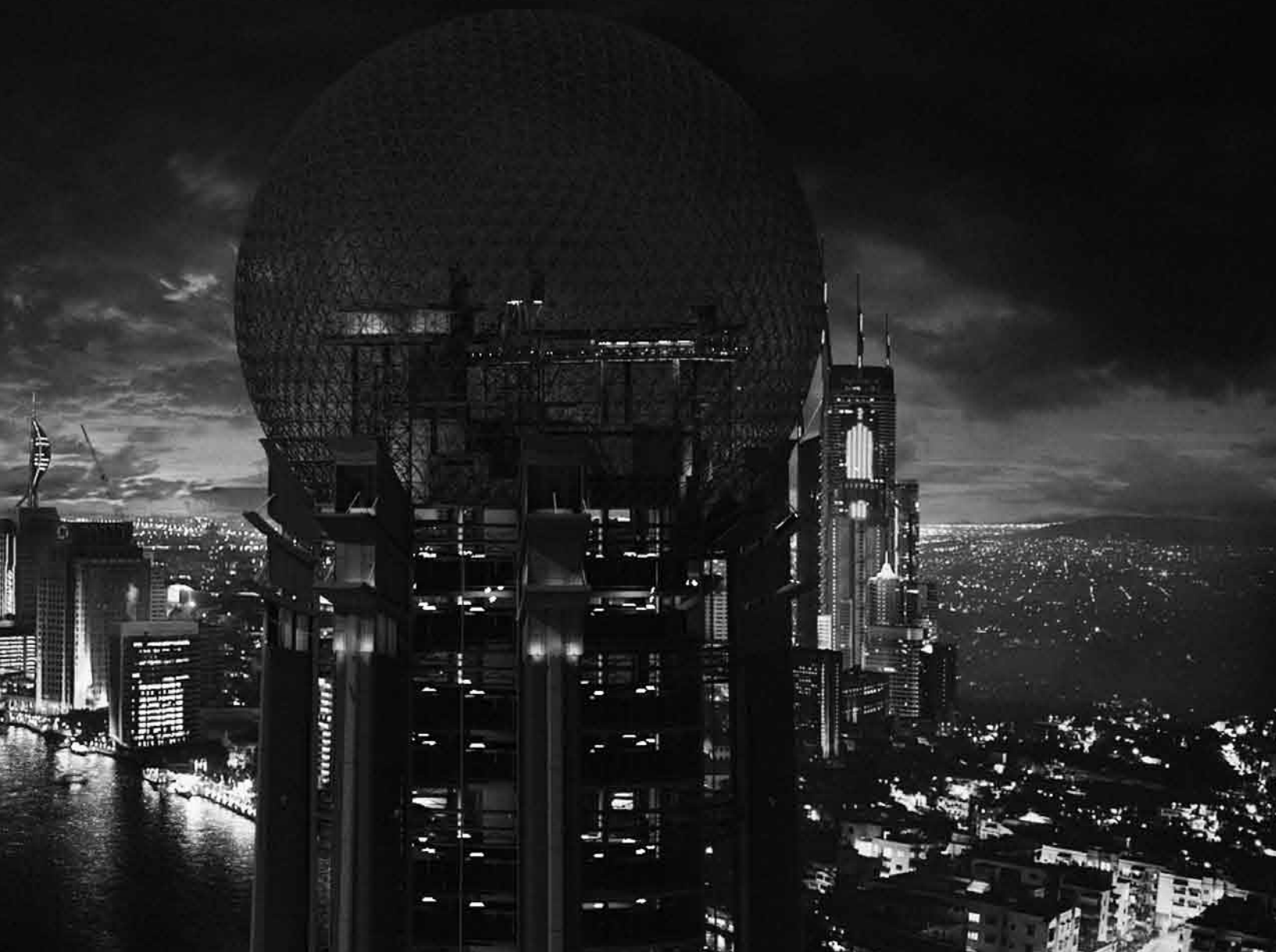
Vue du Montréal futuriste dans Mars et Avril de Martin Villeneuve

puyer, même dans les moments de découragement », raconte Villeneuve. Lepage croyait tellement au potentiel du projet qu'il a décidé d'acquiescer les droits des deux photoromans pour en faire une adaptation cinématographique. Mais l'homme de théâtre en est rapidement arrivé à la conclusion que la meilleure personne pour réaliser cette fiction futuriste était Villeneuve lui-même.