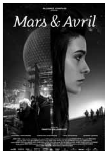
Québec / 2012 / 90 min

Pour en apprendre davantage sur l'aventure de Mars et Avril , visitez www.facebook.com/MarsEtAvril