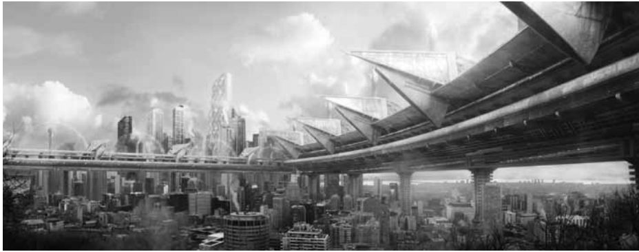
Quelques étapes de transformation de la vue du Belvédère du Mont-Royal : photo de référence, esquisse de François Schuiten, modélisation préliminaire, ajustement de la composition et matte painting final. C'est cette dernière image qui sera ensuite animée avec des effets visuels en postproduction.