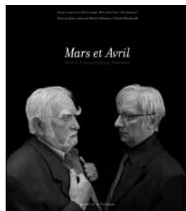
Les deux tomes du photoroman Mars et Avril