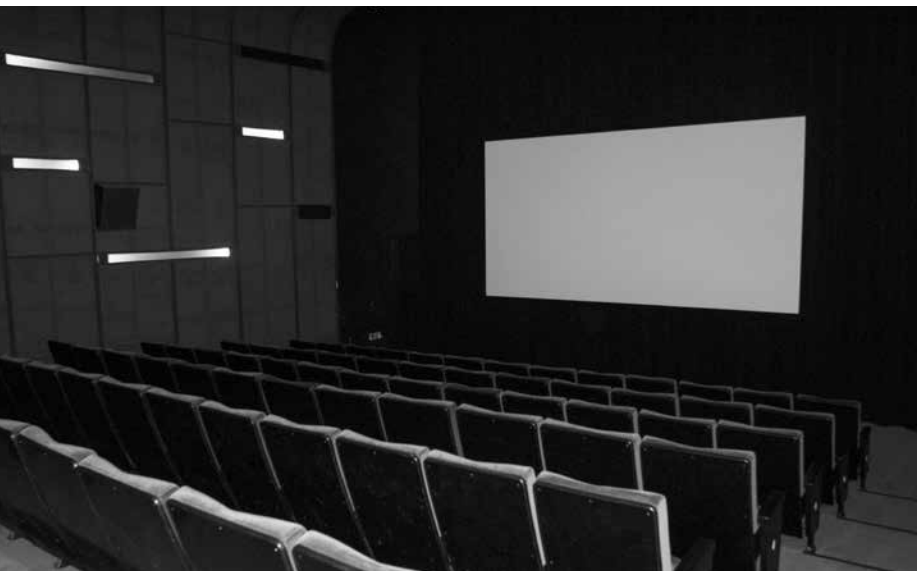
Les salles Claude-Jutra et Fernand-Seguin