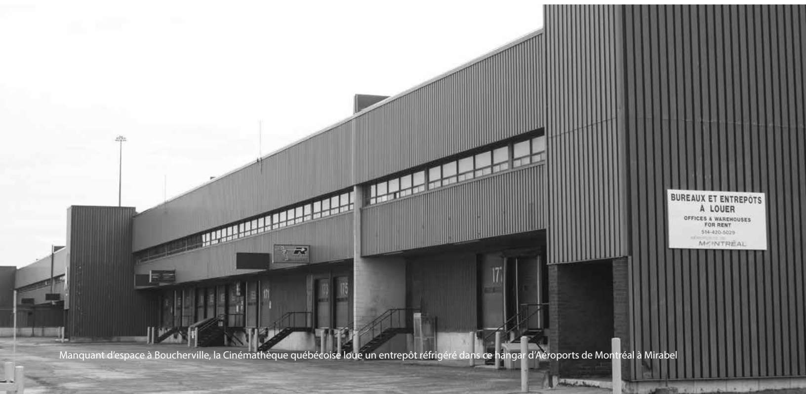
Manquant d'espace à Boucherville, la Cinémathèque québécoise loue un entrepôt réfrigéré dans ce hangar d'Aéroports de Montréal à Mirabel