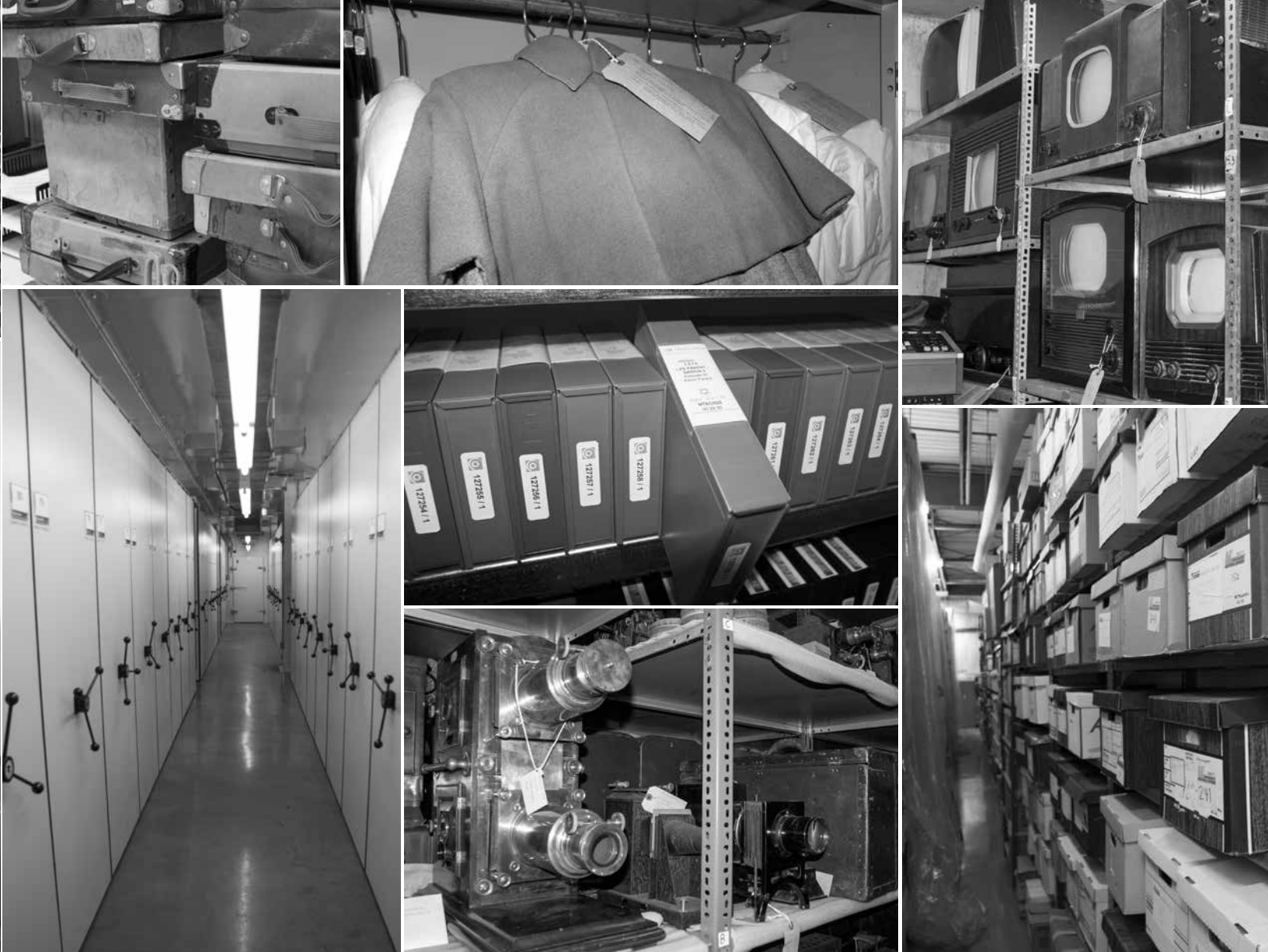
Images d'installations et de collections diverses à l'entrepôt de Boucherville

en place une politique d'acquisition et de gestion des collections digne de ce nom. Ce qu'il a mis deux ans à réaliser, avec son équipe.