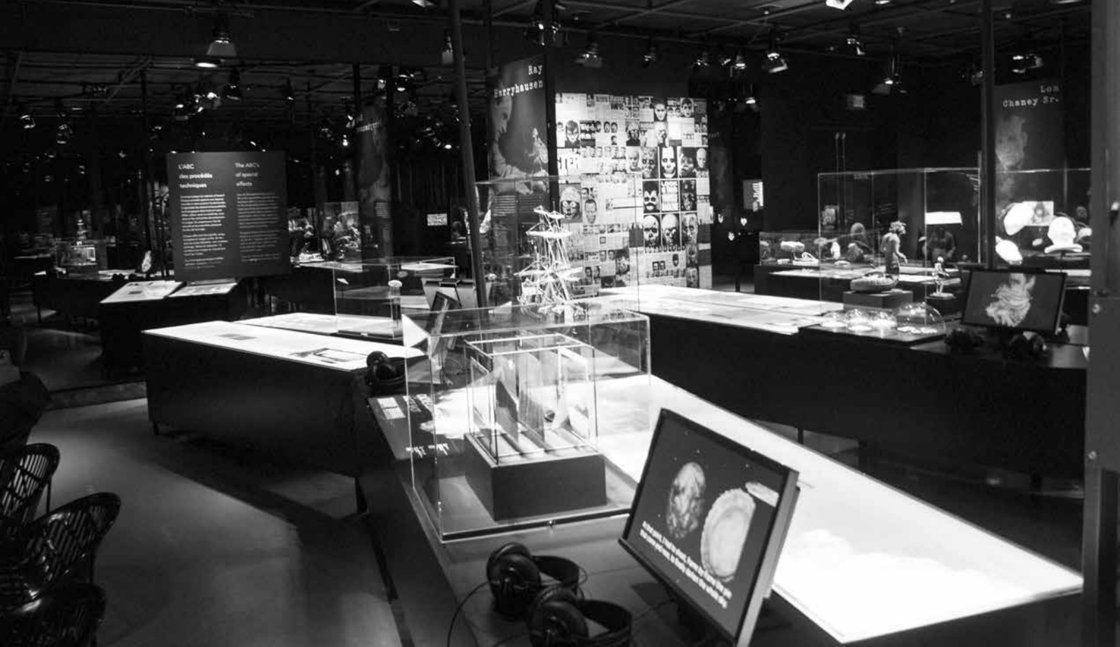
Inaugurée en avril dernier, l'exposition Secrets et illusions – La magie des effets spéciaux occupera la salle Raoul-Barré de la Cinémathèque québécoise jusqu'en 2018

ces deux-là? Parce que dans les deux cas, on est les ayants droit de ces films. Tout le fonds cinématographique de Wieland est venu chez nous, avec les droits. En plus des films, il y aura des enregistrements sonores, des archives de York University, etc.»