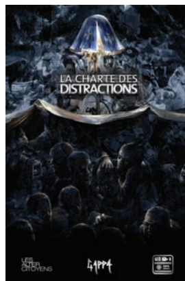
La Charte des distractions est produit par 99%Média, Les Alter Citoyens et GAPP. Site Internet: chartedesdistractions.com

Lorsque nous pensons au cinéma, nous songeons immédiatement aux grandes salles obscures et aux larges écrans. Si la télévision et nos ordinateurs nous permettent de voir des films, ils ne sont pas pour autant capables d'offrir la richesse et la puissance d'une projection en salle.