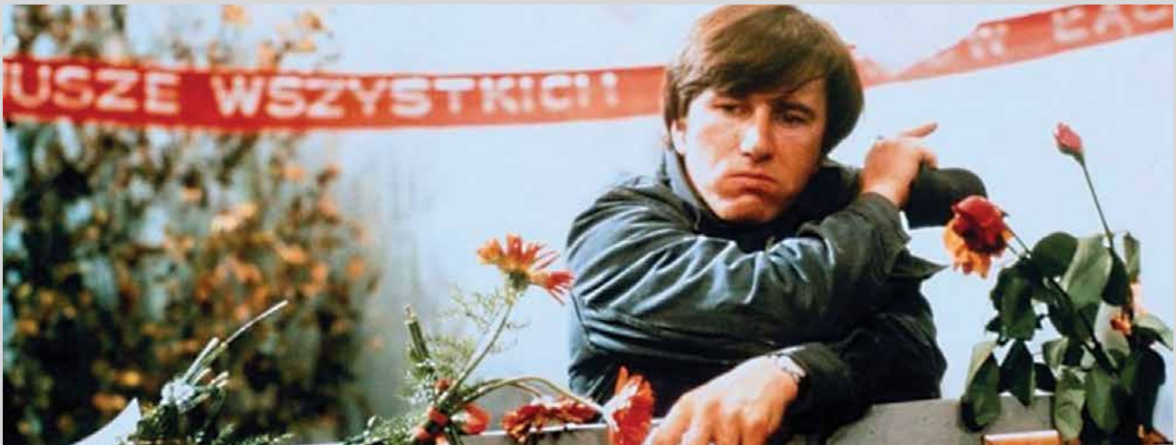
L'Homme de fer