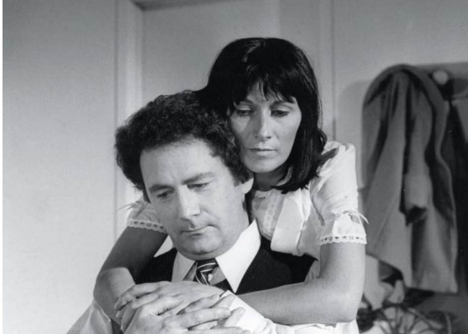
Claude Jutra et Monique Miller dans Pour le meilleur et pour le pire

Vous pensiez que l'on vous le reprocherait parce que vous avez appuyé trop fort sur le crayon?