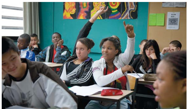
L'Emploi du temps, Ressources humaines, Foxfire, confessions d'un gang de filles et Entre les murs

de l'école, du monde de l'entreprise ou de celui des stages de réemploi; qu'il s'agisse plus généralement des disparités de classe ou ethniques qui semblent déterminer d'avance les chances et le destin des individus, Laurent Cantet mène, au sein de ces structures de groupe, de ces microcosmes sociaux et de ces institutions, des enquêtes de terrain qui refusent de conclure si ce qui s'y joue favorise les progrès et les réalisations ou reconduisent plutôt l'ordre établi avec ses injustices.