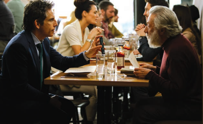
The Meyerowitz Stories

français Édouard Baer: « La vie, c'est tout ce qui se passe quand tout ce qu'on avait prévu n'a pas eu lieu. »