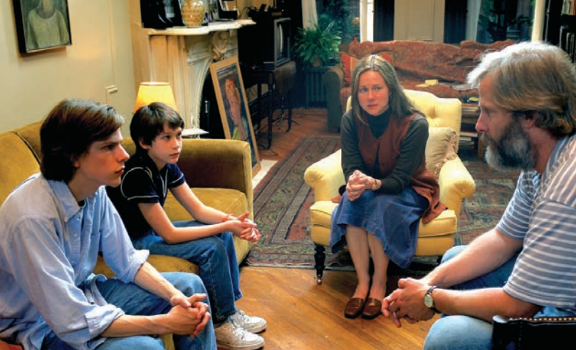
The Squid and the Whale

( Pierrot le Fou , 1965). On le voit avec The Meyerowitz Stories (2017), chronique familiale sans événement majeur guidée par cette saturation de la parole.