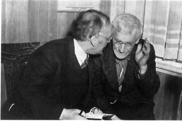
Marius Barbeau à l'école du peuple, août 1941.

Au Collège de Sainte-Anne-de-la-Pocatière, de 1897 à 1903, il continua de la pratiquer sans véritable but, de sorte qu'il affirmera: «Par conséquent, je possédais déjà assez bien la méthode Duployé au moment où je quittai le collège.» Il l'utilisa ensuite régulièrement dans ses études de droit à Laval de 1903 à 1907. La maîtrise qu'il avait de cette méthode s'avéra même pour lui plutôt rentable à cette époque; d'abord, il s'ingénia à faire des relevés complets de ses notes de cours qu'il vendait à ses camarades et, surtout, il fut choisi par le juge Langelier pour recueillir sous sa dictée l'enseignement qu'il professait, lui procurant un revenu d'appoint non négligeable 64 . Cette pratique quotidienne fut en outre l'occasion de raffiner sa méthode puisque le système Duployé s'avérait «à la fois long et encombrant»: