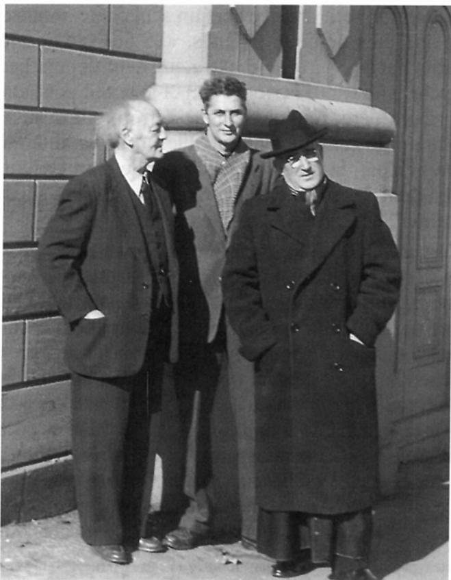
Marius Barbeau, Luc Lacourcière et Félix-Antoine Savard, rue de l'Université, Québec, vers 1950. MCC, cliché J-13918.

Brunswick, que Lacourcière et Savard connaissent depuis 1951 13 et de qui ils ont recueilli, dans son pays en 1952, cinq chansons, six contes et un reel à bouche 14 . Ce soir-là,