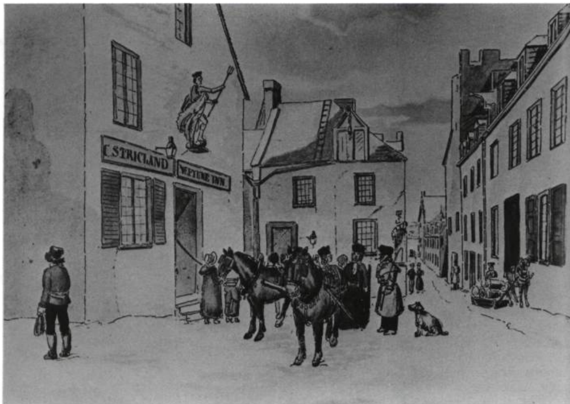
Une taverne de Québec sous le régime anglais: Le Neptune Inn. Gravure de James P. Cockburn.

Histoire d'un commerce en voie de disparition