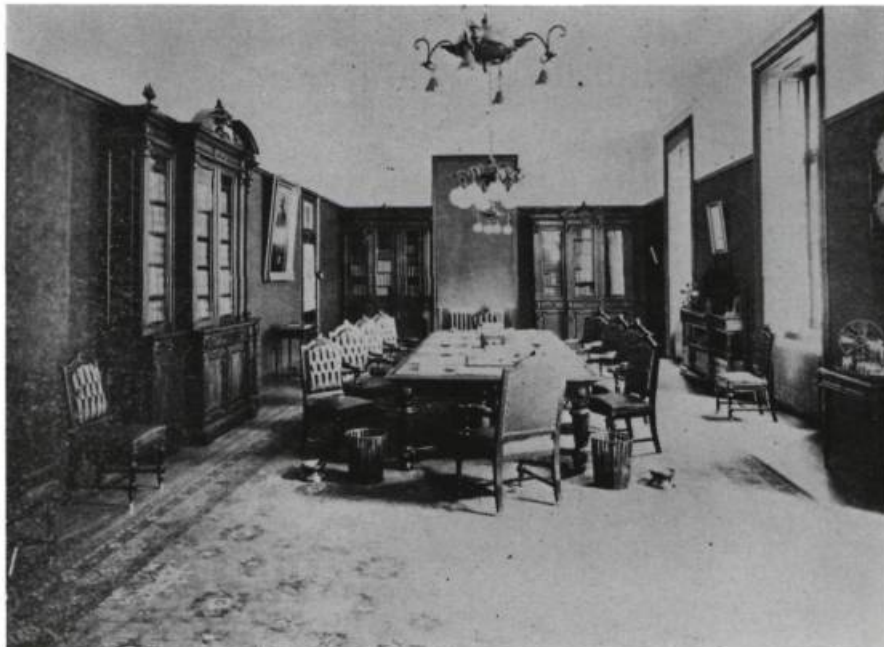
Photo de l'ancienne salle du Conseil exécutif située au premier étage de l'édi- fice Pamphile Lemay.

ment. Cette passerelle est également remarquable par son ornementation: six demi-colonnes cannelées d'ordre dorique soutiennent une corniche et un entablement où deux anges en demi-relief présentent les armoiries anciennes du Québec. On remarque aussi sur le mur de l'édifice, de part et d'autre de la passerelle, un trumeau en bas-relief représentant les blasons de Sir Auguste-Réal Angers, lieutenant-gouverneur de 1898 à 1908.