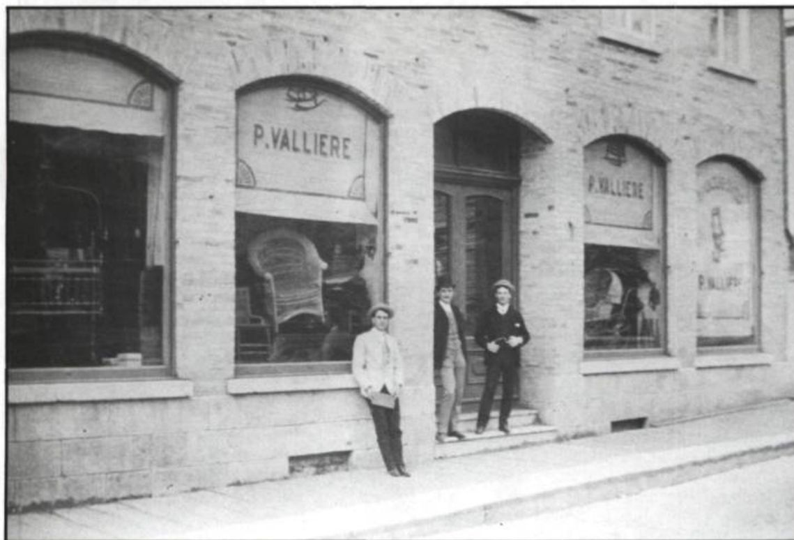
Photo prise de la devanture du magasin de P. Vallière situé sur la rue St-Vallier à la fin du XIX e siècle.