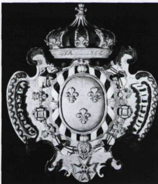
Blason royal de France. Polychrome attribué à Noël Levasseur, vers 1727.