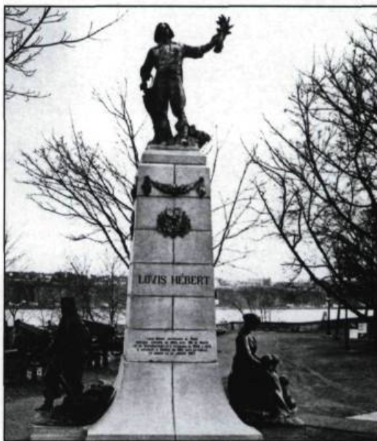
Monument de Louis Hébert entouré de son épouse Marie Rollet et de son gendre Guillaume Couillard, vraisemblablement le premier noyau familial qui vécut de l'agriculture à Québec.

Les changements n'ont pas été moins significatifs dans le monde rural, qui regroupait de 75 à 80 pour cent de la population. Les terres étaient disponibles, extraordinairement abondantes même, par comparaison avec la situation qui prévalait dans la mère-patrie. Encore fallait-il les gagner sur la forêt, trimer toute une vie pour défricher de quoi faire vivre une famille. Et à chaque génération, il fallait recommencer. Quelle qu'ait été la voie choisie, course des bois ou agriculture,