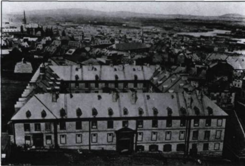
Le Collège des Jésuites fut fondé en 1635. Démoli en 1878, il occupait le site de l'Hôtel de Ville actuel. J.-E. Livernois, s.d. (Archives de la ville de Québec).

les traditions culturelles d'origine ne pouvaient être que profondément transformées.