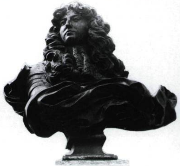
Copie de bronze du buste de Louis XIV sur la Place royale. (Photo: Marc Lajoie, Ministère des Communications du Québec, 1985).

De Québec en effet, les francophones ont esaimé partout sur le continent. Dès l'époque de la Nouvelle-France, des précurseurs – missionnaires, explorateurs, soldats et traitants de fourrures – ont pénétré fort avant dans les nouveaux territoires. Mais l'empreinte culturelle française devait résulter d'un autre mouvement, d'une pratique sociale qui, pour ainsi dire, fusionnait les deux personnages mythiques du premier siècle de notre histoire. Entre l'image du voyageur instable et celle de l'agriculteur confiné à sa terre,