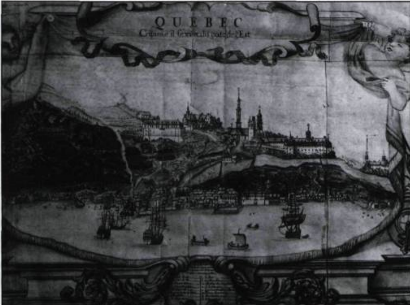
Vue de Québec au XVIII ème siècle. On y aperçoit bien la rue menant à la haute-ville, lieu des institutions gouvernementales et religieuses. Cartouche de la carte de Jean-Baptiste Franquelin, 1688.

Champlain visait également à contrôler tout le commerce vers l'hinterland, jusqu'aux Indes même, grâce au rétrécissement du fleuve à la hauteur de Québec. Incomparable voie de communication, le Saint-Laurent a permis la pénétration des Français à l'intérieur du continent. Port de haute mer, terminus de la navigation océanique, Québec a joué un rôle de plaque tournante et de trait d'union entre les établissements français de l'Amérique du Nord et le reste du monde. Le commerce et la construction navale lui ont valu une renommée internationale.