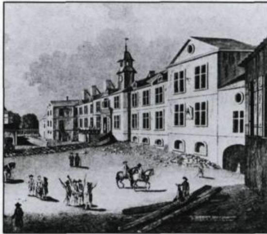
Le Palais de l'Intendant où se tiennent toutes les délibérations sur les affaires de la Province. Gravure de Richard Short, vers 1761. (Archives publiques du Canada).

Jusqu'au milieu du XIX ème siècle, la ville est demeurée un espace de transition et d'adaptation au pays. Malgré la multiplicité des richesses et des possibilités du nouveau continent, deux voies, deux destins s'offraient plus particulièrement. Ils ont donné naissance à deux types culturels plus ou moins mythiques: l'agriculteur et le coureur des bois. Le premier, voulu et recherché par les autorités civiles et religieuses, représentait la sédentarité, la stabilité et la moralité. Le défricheur, fixé sur sa terre nourricière, élevait une nombreuse famille dans le respect de Dieu, du roi et de leurs nombreux mandataires. Le second a davantage été identifié au chevalier des grands espaces, parcourant inlassablement un territoire