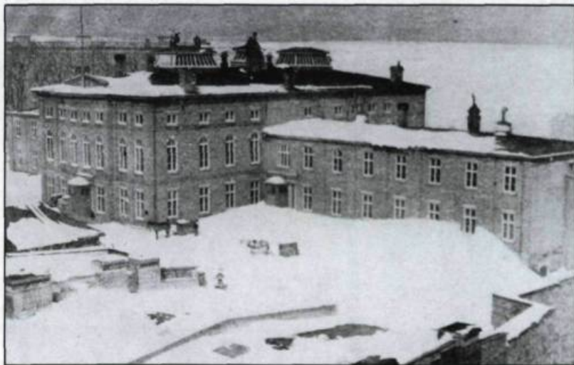
Ancien Hôtel du Parlement à Québec établi dans le parc Montmorency. Il fut détruit par un incendie en 1883.

Ce processus paraît fondamental et constant. Il se produit lors de simples débordements des limites d'une seigneurie, par exemple de Baie Saint-Paul vers les Éboulements. Il se répète sensiblement de la même façon au moment de la création des paroisses de colonisation en Abitibi ou au Saguenay au XIX ème siècle. On le reconnaît à un siècle et à un millier de kilomètres de distance vers la région de Détroit, le pays des Illinois, dans l'implantation à Saint-Boniface au Manitoba ou à Maillardville en Colombie-Britannique. Au XIX ème siècle, quelque 900 000 Canadiens français ont aussi gagné les États-Unis: ouvriers dans les manufactures de textiles ou travailleurs agricoles chez d'autres francophones. Plusieurs en sont revenus après un séjour de quelques années. Un bon nombre s'y est fixé définitivement. Manchester, Lowell, Fall River, Woonsocket deviennent autant de «Petits Canadas» francophones.