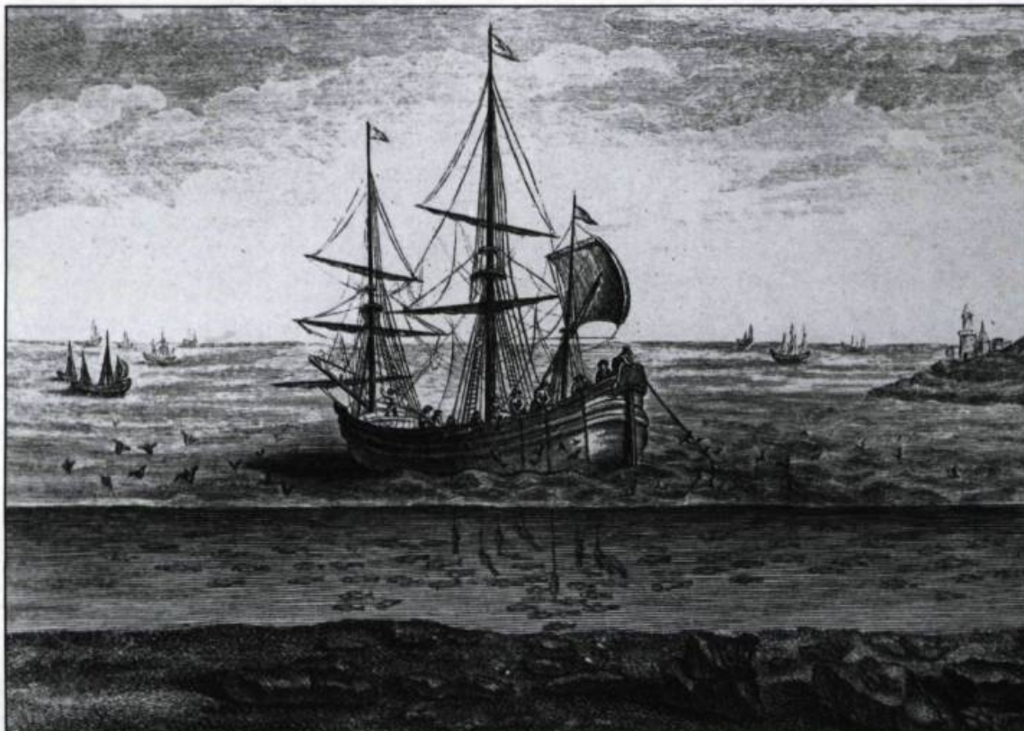
La pêche à la morue sur les bancs de Terre-Neuve. Planche XIII extraite du Traité général des pêches de Dubamel du Monceau, Paris, 1772, Reprint [1984].