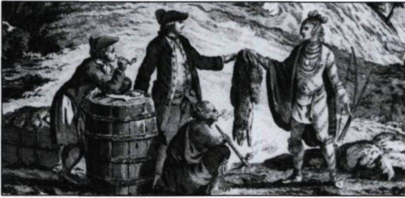
Cartouche de la carte «Inhabited part of Canada...» par Sautbier, Londres, 1777.

Depuis les canons qui protégeaient l'Abitation jusqu'aux portes et remparts actuels, en passant par la construction d'une citadelle au début du XIX ème siècle, les fortifications ont constitué un élément indissociable du paysage urbain.