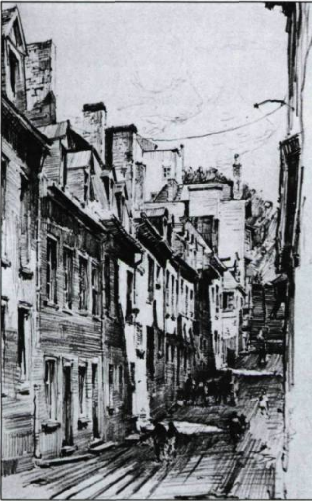
Ce fusain d'Herbert Raine nous rappelle les dessins de Victor Hugo dans la seconde moitié du XIX ème siècle. Le foisonnement de lignes réalisées d'une main sûre et rapide, par Herbert Raine, contribue à mettre l'embase sur l'aspect délabré de ce secteur déjà surpeuplé. Herbert Raine, Little Champlain Street, Québec .