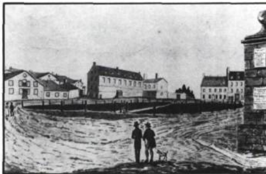
La Place d'Armes à Québec en 1829. Face à celle-ci se trouvait la résidence de John Charlton Fisher. Aquarelle de J.P. Cockburn, Royal Ontario Museum, Toronto.

Homme d'une grande culture, s'intéressant tout autant à l'histoire et à la littérature qu'à la linguistique et à l'astronomie, John Charlton Fisher participa activement au développement de nombreux organismes culturels de langue anglaise dans sa ville d'adoption. Présent partout, il faisait souvent office de scribe et de coordonnateur.