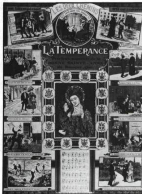
Les sociétés de tempérance des diocèses de la province distribuèrent des illustrations moralisatrices à leurs nouveaux adhérents. Image polychrome de L.-A. Morissette intitulée Les deux chemins présentant 10 scènes dichotomiques sur la tempérance. Ministère des Affaires culturelles, Québec.

Pour ouvrir une première brèche, ils prêchèrent contre la coutume de «traiter» au Jour de l'An: peu à peu, les consommations se rarifièrent à tel point dans les salons qu'on jugea de mauvais goût d'offrir «un petit verre» aux invités et aux visiteurs.