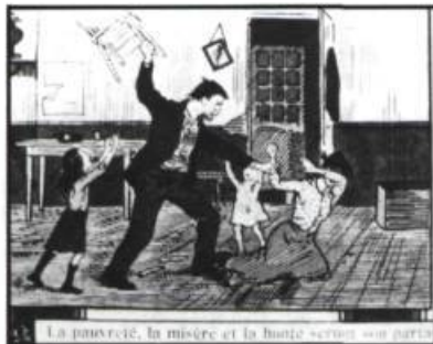
Deux des scènes de la gravure Les deux chemins de L.-A. Morissette, Montréal.