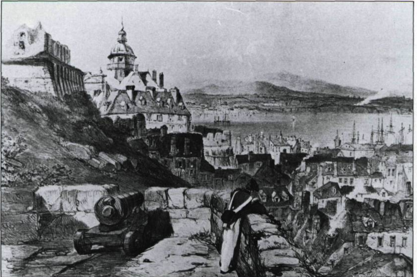
Prise du promontoire, cette vue de Québec avec sa Citadelle dominant la basse-ville et le fleuve, son château Saint-Louis en ruines illustre bien l'aspect moyenâgeux signalé par Henry Thoreau. Gravure d'après un dessin de Coke Smyth pour Sketches with Canadas , 1840. (Coll. privée).

Un demi-siècle plus tard, en 1893, la comtesse d'Aberdeen, en reportage photographique au Canada, n'ose décrire la situation. Elle conseille à ses lecteurs de regarder les illustrations de son livre pour constater la beauté des lieux. Et elle aime bien le peuple québécois. Il s'agit pour elle d'un peuple « frugal, satisfait, respectueux des lois et religieux »; toujours de simples paysans normands et bre-