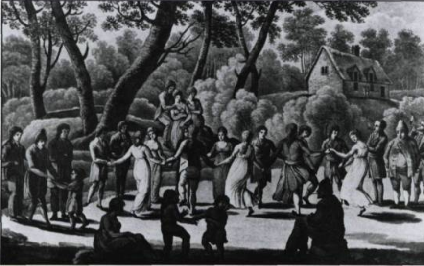
Plusieurs visiteurs de Québec ont signalé et remarqué la gaieté des Canadiens français. Aquarelle de J.C. Stadler, d'après un dessin de George Heriot in Travels Through the Canadas , 1807.

du fleuve devient intolérable. La haute-ville, par contre, héberge « les gens distingués », comme le dit Kalm. Après la Conquête, marchands et militaires anglais s'installent en grand nombre. Mais rien n'empêche que la ville parait « étrange pour le