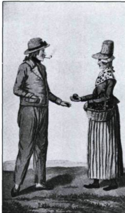
Habitants en costume d'été. Tiré de: John Lambert, Travels Through Canada, 1816.

Haute-ville et basse-ville: la distinction remonte aux origines de Québec. Tous les voyageurs ont noté les deux niveaux d'habitation, le passage unique par la Côte de la Montagne, le site «imprenable» du Cap-aux-Diamants. Les voyageurs s'épargnent souvent des mots en référant les lecteurs à leurs prédécesseurs. Les Anglais, nous dit le Duc Bernhard de Saxe-Weimar en 1825, comparent facilement Québec à Gibraltar. Charles