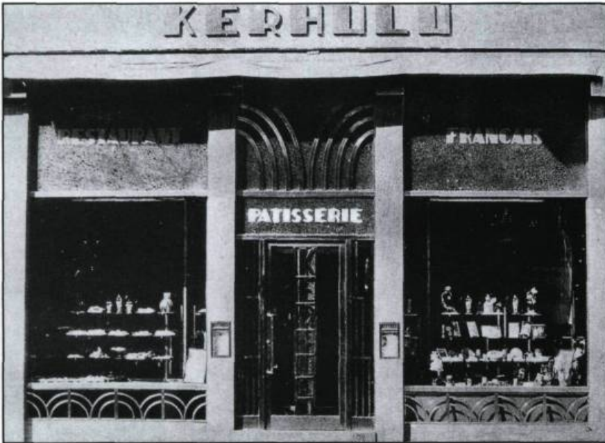
Maurice Genevoix, de passage à Québec en 1939, écrit que le restaurant Kerbulu était à son époque le meilleur établissement du genre au Canada. Carte postale.

tons, en réalité, ils constituent de loin les plus loyaux sujets de Sa Majesté. La politesse et la courtoisie générale de ces gens, qui s'amuse comme des petits fous à chaque hiver, l'ont frappée! Cette appréciation idyllique néglige pourtant un volet fondamental, noté par plusieurs, de la vie québécoise, celui de la stricte séparation des «races». N.P. Willis note, en 1839, que si la vie sociale s'y déroule d'une manière généralement plus gaie que dans la moyenne des villes coloniales, les différentes classes ne se fréquentent pas entre elles. Les Français, plus raffinés à ses yeux, souffrent du dédain de leurs maîtres anglophones. Bigsby note, lui aussi, l'étanchéité des relations sociales. Les Canadiens français, d'après lui, mènent une vie sociale fort active entre eux, mais côtoient rarement les anglophones, sauf lors des occasions officielles au Château Saint-Louis.