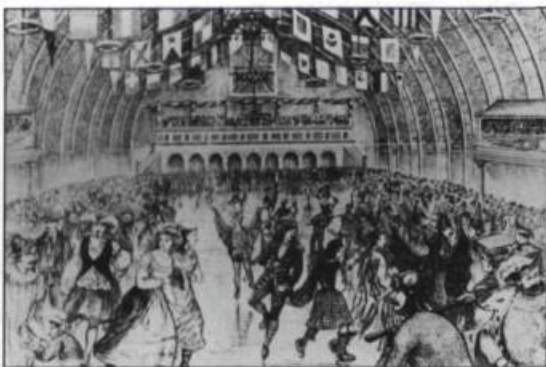
Patinoire couverte située sur la Grande-Allée Gravure d'après un dessin de W.O. Carlisle pour Recollections of Canada, Londres. Chapman et Hall, 1873.