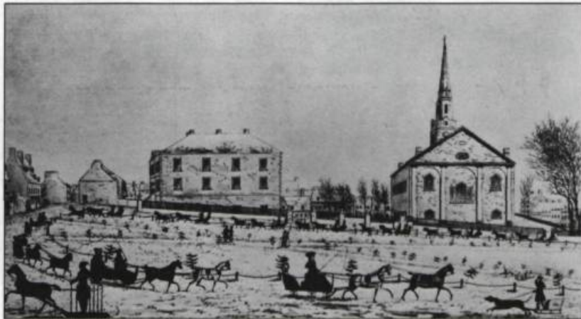
Dès le début du siècle, la carriole canadienne est à l'honneur. Les amateurs, regroupés en association, comme le Quebec Driving Club et le Tandem Club organisent des parades sur la Place d'Armes. Gravure de J. Smillie d'après un dessin de William Wallace D. Smillie & Sons, Québec. 1826.

D'abord sociale, la promenade en traîneau est surtout populaire dans la première moitié du XIX ème siècle. Elle donne l'occasion à ses propriétaires d'afficher chevaux, attelages, carrioles et même l'habillement des passagers.