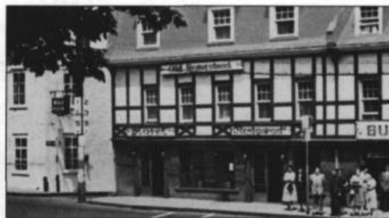
Vue du Old Homestead où se rencontraient les acteurs des carabinades après les répétitions. Carte postale.

Bref, ces souvenirs à vol d'oiseau peuvent sembler banals; au contraire ils sont pleins de suc! Le plaisir des répétitions, la camaraderie de bon aloi, le souci de rendre l'idée de l'auteur étaient toujours présents. La finesse des textes, des tableaux, des satires de l'actualité, ne manquaient ni de piquant, ni d'humour!