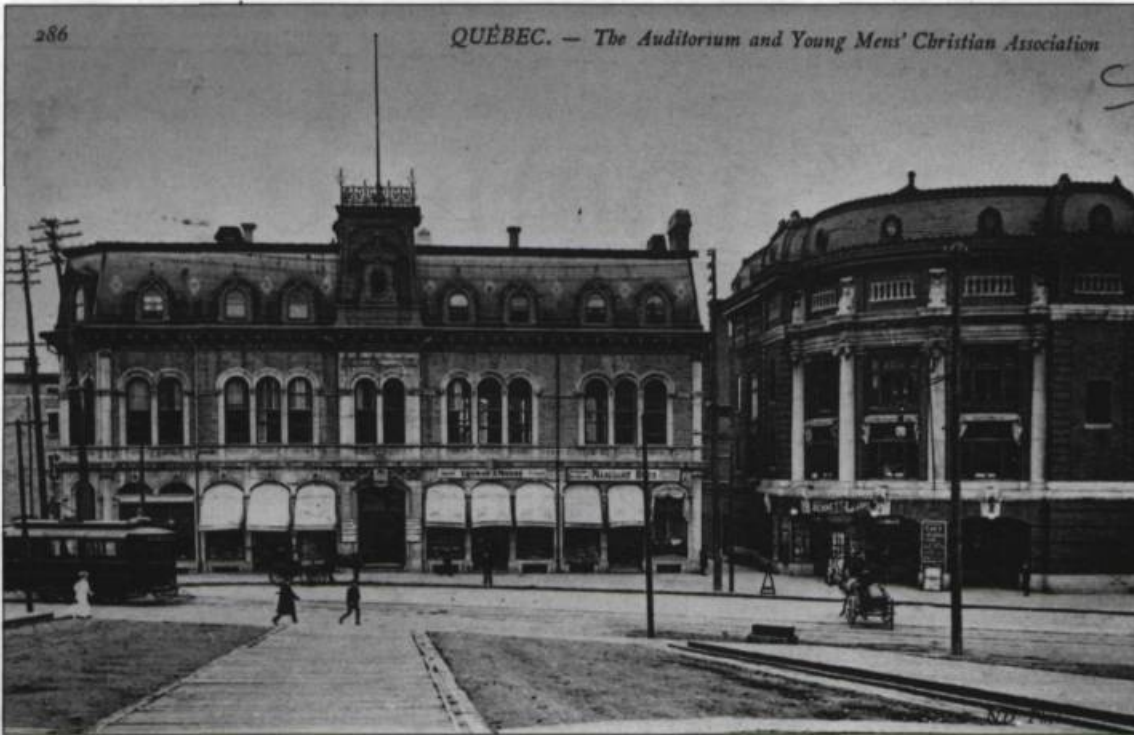
Vue extérieure du théâtre Capitol où se déroulaient les spectacles montés par les carabins. Carte postale.

cours de popularité des parades de raquetteurs et, surtout, un soir de triomphe où l'on promène, à travers le quartier de la Haute-ville, le char magnifique où trône la reine des étudiants. Deux de ces Reines, toutes deux fort élégantes, brillantes en plus d'être jolies, épousèrent: l'une un jeune avocat et futur juge et l'autre, un jeune médecin, déjà consul de son pays à Québec. Carnaval de neige et de parades d'aujourd'hui... Carabinades de l'époque des années trente, vous vous rejoignez dans nos souvenirs avec même saveur et même ferveur!