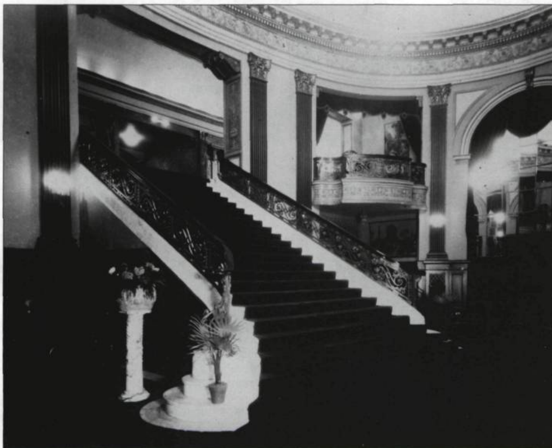
L'escalier du foyer du théâtre Auditorium transformé en cinéma Capitol vers 1927.