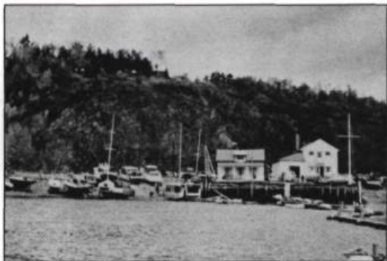
Spencer Cove à l'automne.

À l'été 1954, un ouragan s'abat sur Québec. Le fameux vent du nord n'épargne pas le club: 44 des 72 yachts à l'ancre partent à la dérive et vont s'échouer ou se défoncer sur les rives rocheuses. Il fallut près de dix ans pour colmater les brèches que ce désastre avait causées dans la flotte du club. Le public québécois se désintéressait d'ailleurs des régates depuis un bon demi-siècle. Après l'incident, les marins qui continuèrent de s'adonner à la voile furent certainement animés d'un excellent moral.