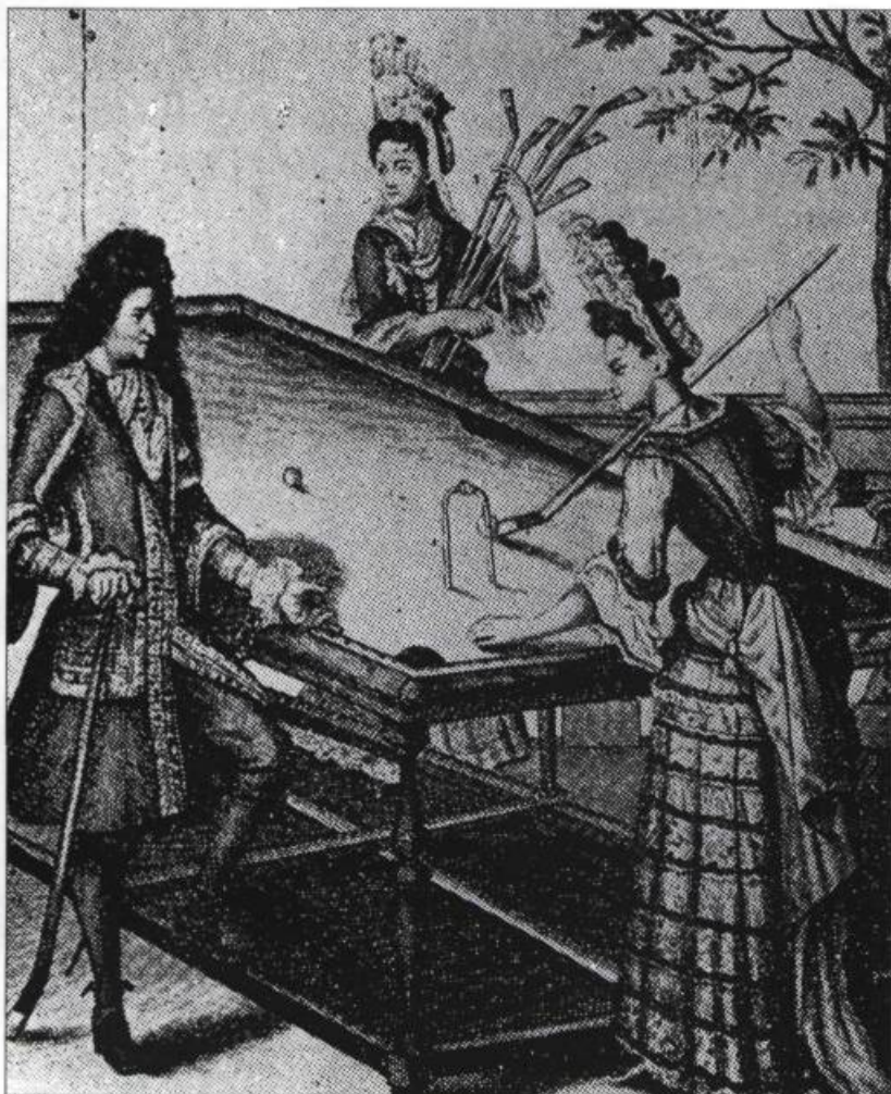
Autrefois, le jeu de billard se pratiquait à l'aide de bâtons recourbés. Nos racines, p. 303.

lui fournir un meilleur éclairage. Pareilles exigences spatiales et financières ne mettent pas la possession d'une table de billard à la portée de tous.