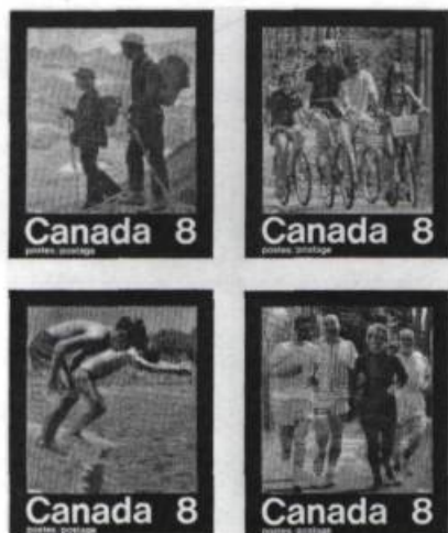
Timbres pré-olympiques émis en mars 1974 par le Ministère canadien des Postes.

Douze années après sa parution cette série n'est pas encore rare sur le marché. Mais alors que le contribuable essaie d'oublier le déficit olympique et que les collectionneurs se relèvent de