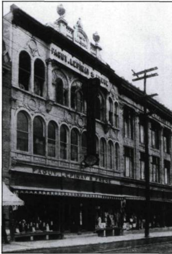
Aujourd'hui démolis, les deux magasins Faguy, Lépinay et Frère de la rue Saint-Jean illustrent la tendance de l'architecture commerciale du tournant du XXIème siècle. (Québec, Canada. The Publicity Bureau. 1912).

une bonne occasion de faire du lèche-vitrine pour les badauds de la rue!