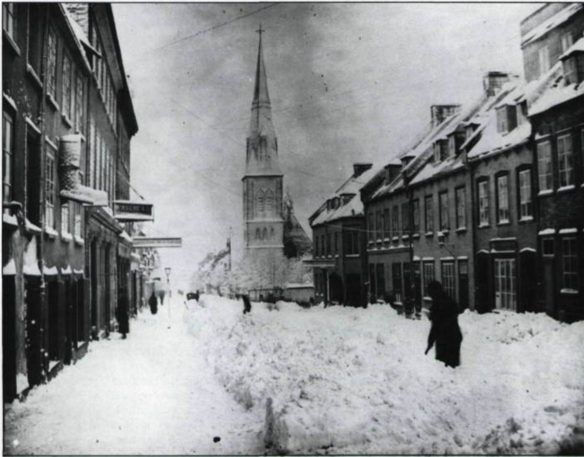
La rue Saint-Jean avant l'incendie de 1881. La plupart des façades affichent leur enseigne. (Inventaire des oeuvres d'art du Québec).