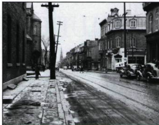
Cette photographie des années 1940 illustre bien l'engouement pour le toit mansardé à la fin du XIX ème siècle.

En toute hâte, les marchands entreprennent la reconstruction de leurs commerces. En peu de temps, le visage de la rue Saint-Jean se remodèle selon le goût du jour. Et, en 1880, le choix de l'heure se confond avec le style Second Empire. Fort populaire en France sous le règne de l'empereur Napoléon III (1852-1870), ce courant nous parvient par le biais des Etats-Unis et, dans une moindre mesure, de l'Angleterre. Déjà, au début de la décennie 1870, de prospères marchands de gros de la rue Dalhousie, les Amyot, Chinic et Beudet, avaient tâté cette mode avec l'introduction du toit mansardé sur leurs vastes entrepôts. Cependant, à Québec le véritable coup d'envoi est donné en 1877 par la construction de l'Hôtel du Parlement selon les plans de l'architecte Eugène-Etienne Taché. Les nombreux décrochements en pavillon, les tours élancées, le décor sculptural (statues, niches, bas-reliefs, colonnes) et classique ainsi que le toit mansardé sont l'apanage du style Second Empire.