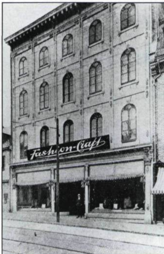
Entièrement remodelé par les architectes Berlinguet et Lemay en 1899, le magasin Delage et Gauvreau (plus tard Fashion-Craft) se distingue des petites boutiques voisines. (Archives de la ville de Québec).

L'effet est encore plus saisissant lors de l'érection du magasin d'instruments de musique C.W. Lindsay, à l'angle de la rue Saint-Eustache, en 1914. Avec ses cinq étages et ses deux façades principales de 43 pieds et de 65 pieds de largeur, l'édifice