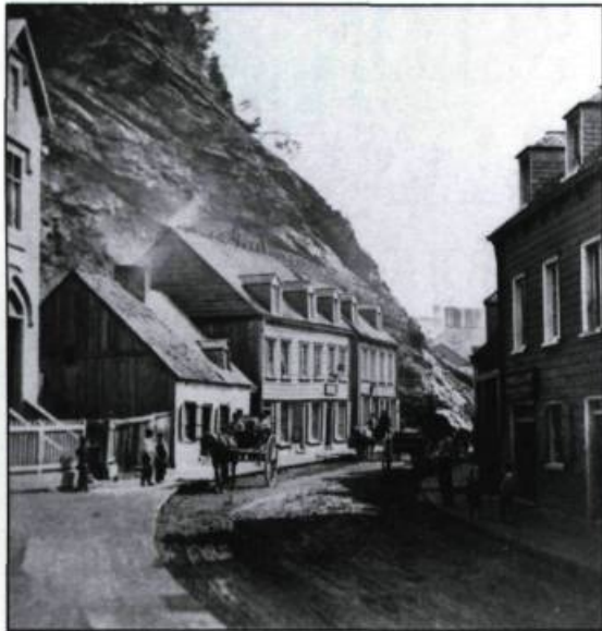
La rue Petit Champlain vers 1865.