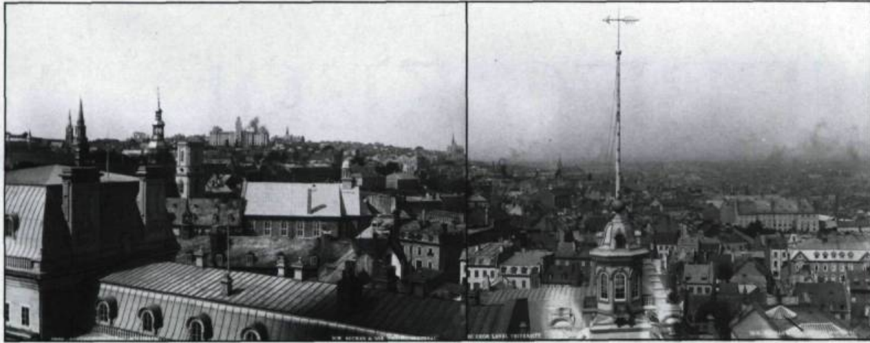
Panorama en trois photos montrant une vue de Québec prise en 1895. Jusqu'à maintenant seules les photos de gauche et du centre étaient connues. La découverte de la photo de droite nous permet de présenter le panorama au complet.

Il est intéressant de noter que la vision de Notman n'est stimulée que par la fierté du conquérant anglais et l'attrait commercial: l'artiste prend avant tout les photos qu'il pense pouvoir vendre avec facilité. Donc, pour faire une lecture juste de ses clichés, il importe de savoir à qui elles s'adressent. Les thèmes exploités nous renseignent sur l'identité du public-cible. Notman photographie surtout la présence anglaise militaire, administrative et commerciale. Lorsqu'il photographie la rue du Petit Champlain, c'est l'exotisme de la rue pavée de madriers qui l'intéresse et non les gens qui y vivent; partout il semble réduire le citoyen francophone à un traitement folklorique. En ce sens, on peut penser qu'il a une vision particulière de Québec, comme capitale conquise de l'Empire britannique, et que ses photographies s'adressent davantage au touriste anglophone et à la société anglo-canadienne. L'approche de Notman sera reprise par plusieurs peintres paysagistes et photographes tout au long de la seconde moitié du XIX ème siècle et au début du XX ème siècle. Il ne faut pas s'étonner d'un tel état de fait: à cette époque, la plupart des promoteurs des grands projets de mise en valeur par l'image sont de grosses compagnies anglo-canadiennes tel le Canadien Pacifique.