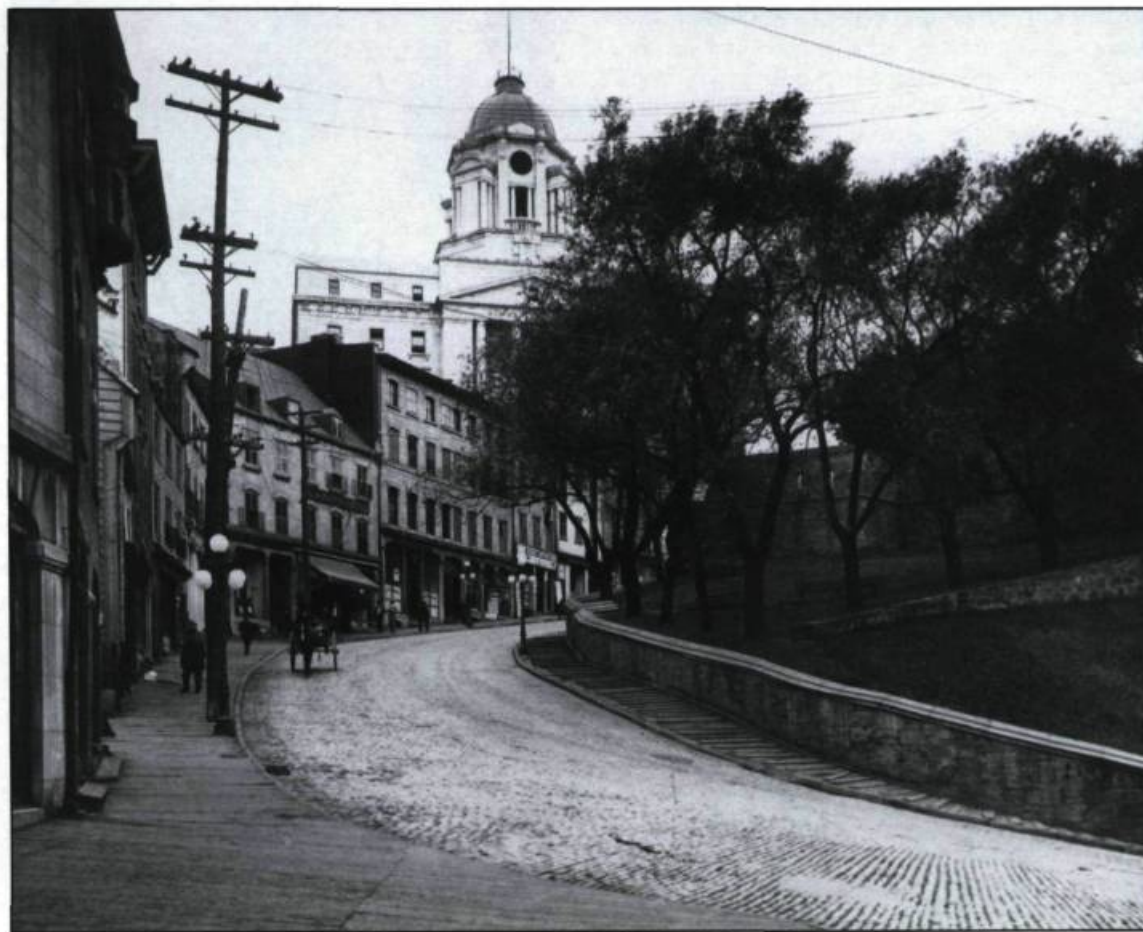
Vue de la Côte de la Montagne.

d'ensemble de la ville, des vues de la Citadelle, des portes, des édifices administratifs et quelques scènes de rues, principalement de la rue du Petit Champlain. De retour à Québec, en 1865, puis vers 1867, il met à jour ses photographies commerciales. En 1872, il s'intéresse, cette fois, à l'activité portuaire et au chargement du bois dans les voiliers au long cours. Ce sont les activités économiques principales de Québec à l'époque. Dans cette série, Notman s'applique à montrer le travail d'ensemble et des vues générales. Il observe, de loin, marins et dockers.