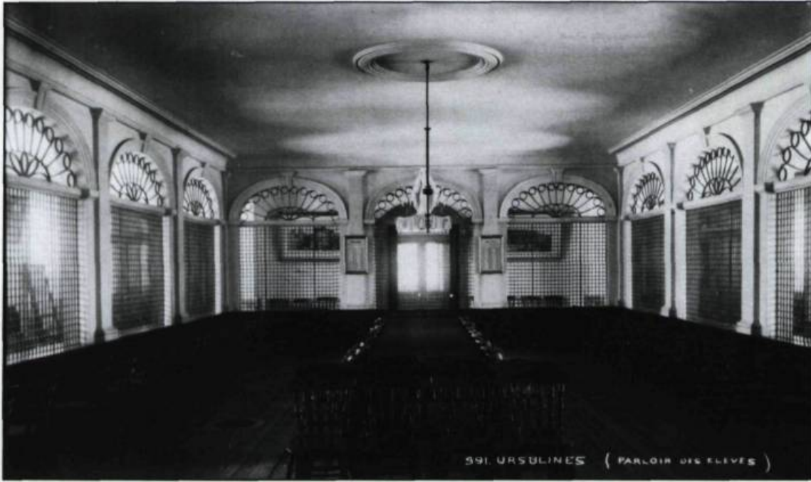
Le parloir grillagé des élèves où les jeunes filles pouvaient, une fois la semaine, entre midi et une heure, voir leurs proches. Photographie prise vers 1888 par Jules-Ernest Livernois montrant le parloir situé dans l'aile Saint-Joseph, érigée en 1857. (Archives publiques du Canada).