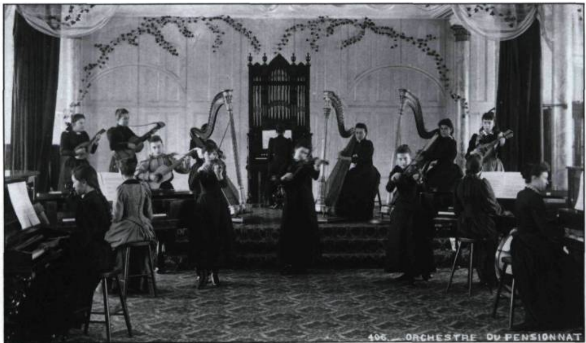
106 — ORCHESTRE DU PENSIONNAT