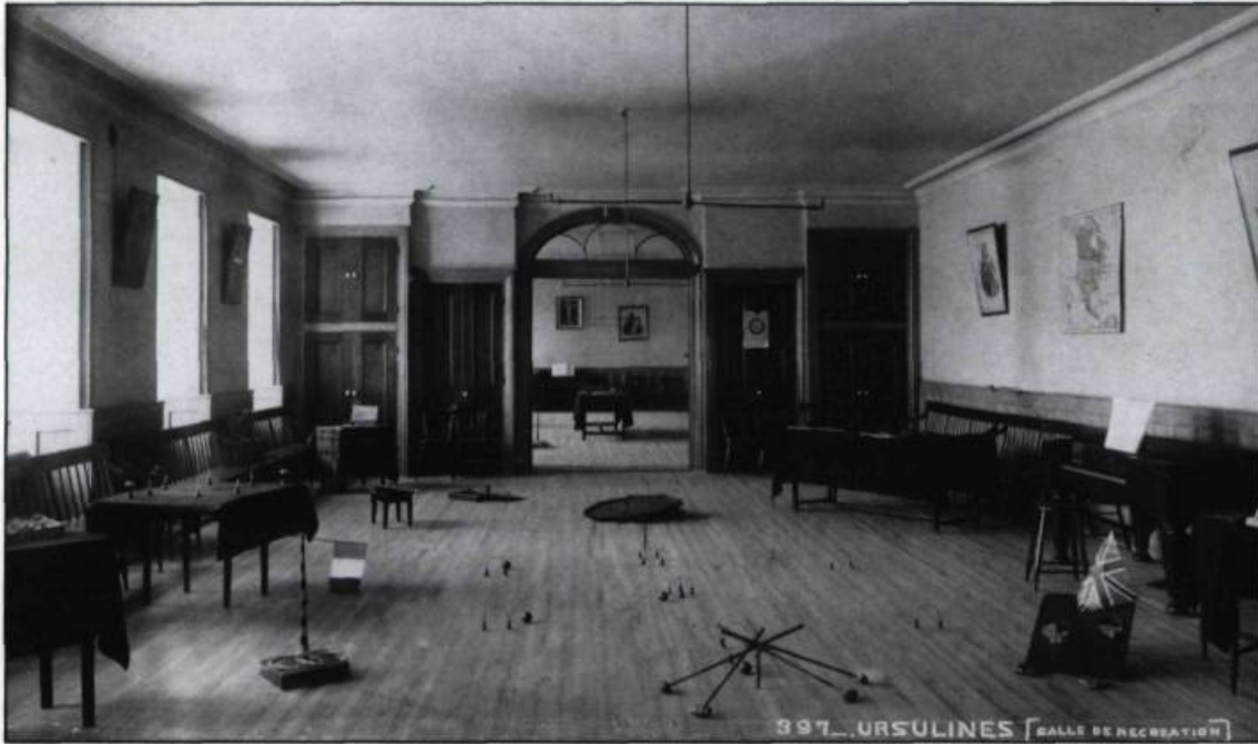
La salle de récréation où les pensionnaires viennent jouer au croquet, au piano et autres jeux.

naires, scrutent les espaces grillagés, observent les mouvements des religieuses entre la prière, le sommeil et l'enseignement, s'amuse avec les pensionnaires et réalisent de véritables photo-reportages qui dévoilent le couvent cloîtré.