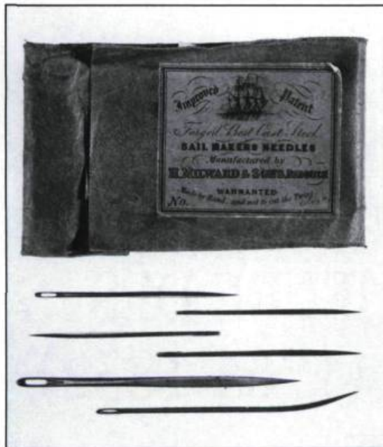
Aiguilles appartenant à un artisan voilier irlandais établi à Québec au début du XIX ème siècle. (Musée canadien des civilisations).

Après 1760, les Britanniques remplacent les Français dans le contrôle du grand commerce. C'est ainsi que la plupart des Canadiens sont écartés du commerce d'exportation et d'importation en