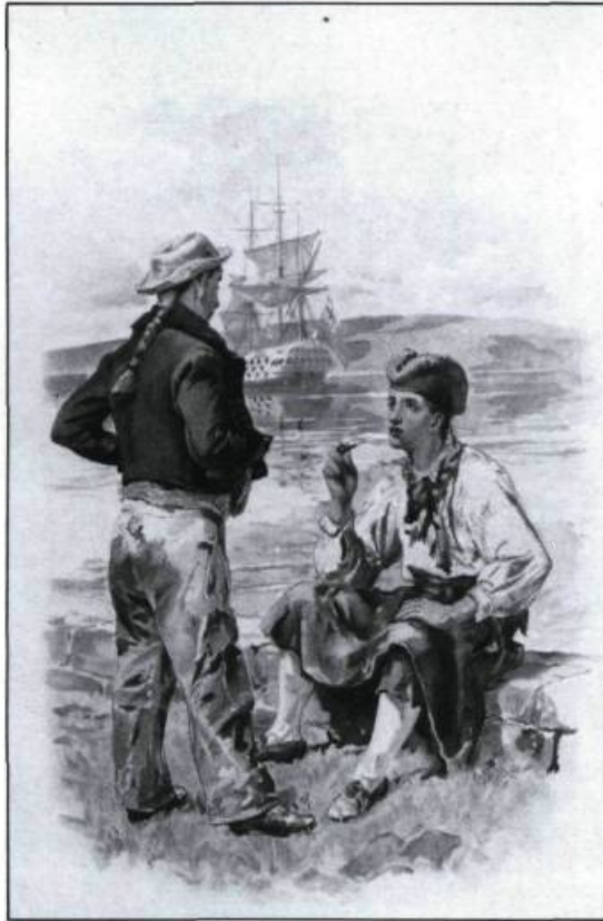
Jeunes matelots britanniques. Dessin réalisé vers la fin du XVIII ème siècle. (Musée canadien des civilisations).

cile à Québec. Mais leur passage gonfle la population flottante et exerce une forte influence sur l'environnement social. Pendant que les soldats donnent à la haute-ville l'aspect d'une véritable réserve militaire, les autres groupes transforment la basse-ville en un centre ouvrier très cosmopolite.