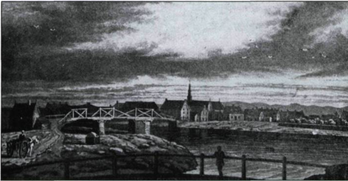
Le village de Montmagny au début du XIX ème siècle.

villageois; d'autre part, les seigneuries de la Côte-du-Sud se trouvent relativement saturées. Selon l'arpenteur Joseph Bouchette, qui parcourt la région au début du XIX ème siècle, il reste bien peu de nouvelles terres à concéder dans la zone seigneuriale.