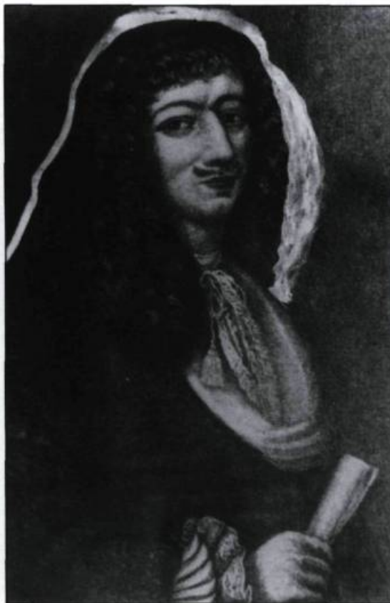
Jean Talon (1626-1694). Nommé intendant de la Nouvelle-France quelques mois après la prise en charge de la colonie par Louis XIV, il y fit deux brefs séjours: 1665-1668 et 1670-1672.

À ces noyaux familiaux, s'ajoutent plusieurs célibataires. Des Français d'abord, issus des vagues successives d'immigration des années 1660 et 1670; mais aussi de jeunes Canadiens parvenus à l'âge de s'établir. Pour ces célibataires, un mariage rapide, surtout avec des filles de familles déjà installées, représente le meilleur gage d'un établissement durable.