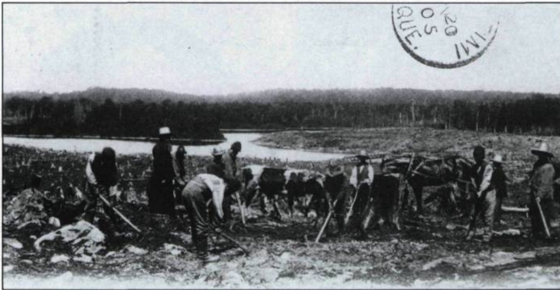
Jeunes orphelins défrichant une terre sous la direction de l'abbé Brousseau, à Saint-Damien, vers 1905. (Carte postale).