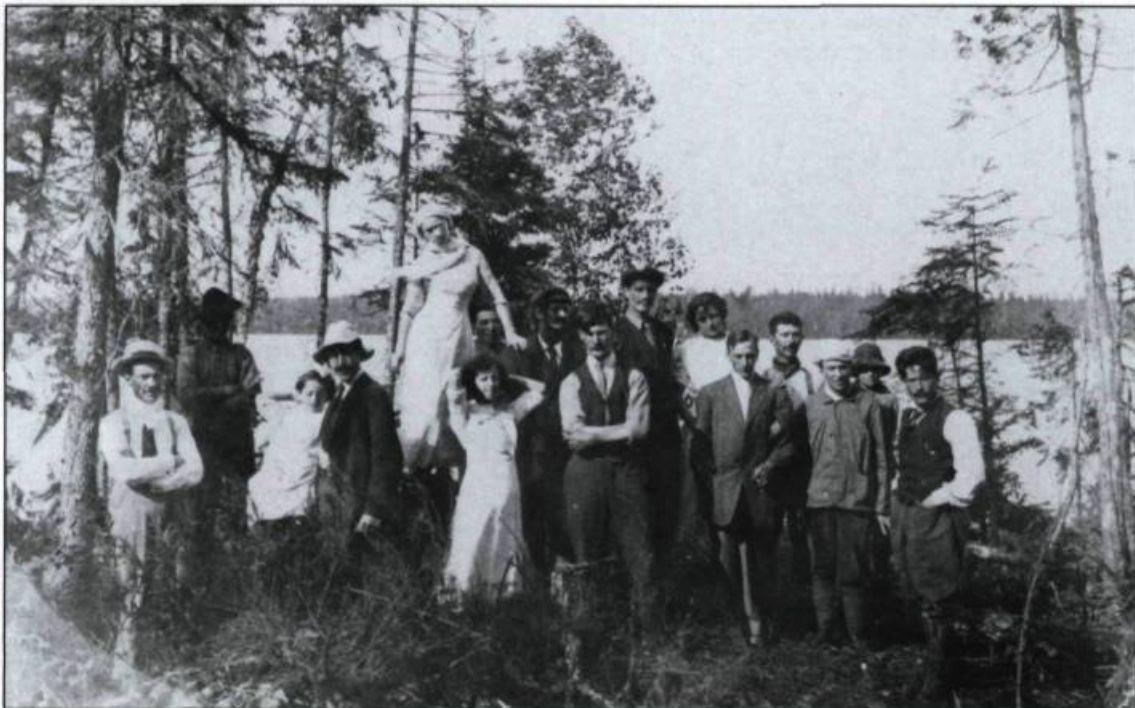
Groupe de colons au lac Okikiska, en Abitibi (6 juillet 1912).

culture devaient entraîner dès 1840 un mouvement migratoire vers les États-Unis. Ce mouvement prend une ampleur plus considérable au fur et à mesure qu'avance le XIX ème siècle. En effet, selon le géographe Raoul Blanchard, plus de 1 000 personnes quittent à chaque année la région pour les États-Unis ou pour les territoires de colonisation du Québec. Ce phénomène a même incité un généalogiste de Bellechasse à dénombrer les mariages de Franco-Américains de son comté. Au début du XX ème siècle, Kamouraska est le territoire le plus affecté. En 1909, 298 personnes quittent le comté; les deux tiers se dirigent vers les États-Unis. L'émigration touchera à peu près toutes les paroisses de la région.