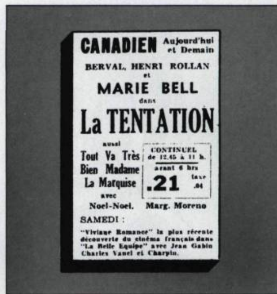
Le cinéma Canadien, sur la rue Saint-Jean, annonce le film « La Tentation ». (Le Soleil, 7 janvier 1937).

sont filmées par France-Film et ce film, auquel s'ajoutent des scènes de la vie du saint homme, est présenté en primeur le lendemain à Québec, aux cinémas Victoria et Canadien. Ce film fait cependant contraste avec la programmation française habituelle alors dominée par les succès de Gaby Morlay, d'Edwidge Feuillière, de Rosine Deréan, de Claude Dauphin et d'autres. Marie Bell triomphe dans le film La tentation , drame de Charles Méré. Peu auparavant, une équipe française est venue tourner au Québec Maria Chapdelaine avec Madeleine Renaud dans le rôle titre. Les affiches du cinéma américain sont illuminées par les noms d'Irene Dunne, de Clark Gable, de Spencer Tracy, entre autres.