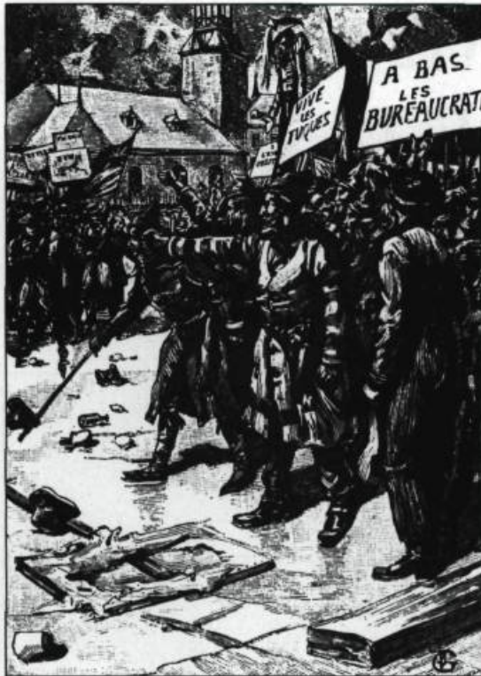
Gravure du G. Tiret Bogner illustrant un violent échange entre Les Fils de la liberté et les membres du Doric Club à la Place d'Armes de Montréal, le 6 novembre 1837. (Le Monde illustré, vol. 6, no 300).

gens sont disposés à se révolter car ils n'ont plus rien à perdre. A ce moment intervient un deuxième facteur: l'ambition démesurée de l'élite sociale des Canadiens français, composée surtout de membres des professions libérales. Le discours démocratique de cette élite ne serait que de la poudre aux yeux. C'est le pouvoir qu'on vise, pas la vertu.