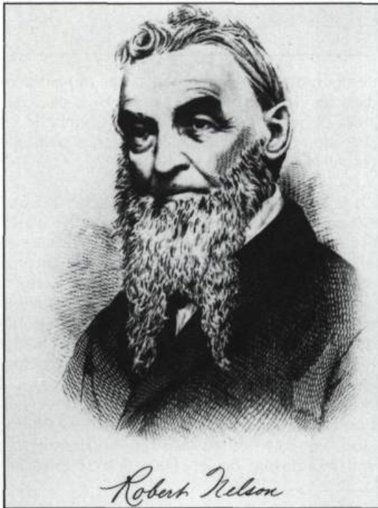
Le patriote Robert Nelson, l'un des artisans du soulèvement de 1838 dans le Bas-Canada. (Archives nationales du Québec).

gens sont disposés à se révolter car ils n'ont plus rien à perdre. A ce moment intervient un deuxième facteur: l'ambition démesurée de l'élite sociale des Canadiens français, composée surtout de membres des professions libérales. Le discours démocratique de cette élite ne serait que de la poudre aux yeux. C'est le pouvoir qu'on vise, pas la vertu.