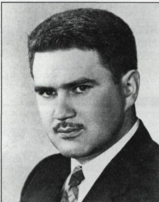
L'historien Fernand Ouellet, auteur de plusieurs ouvrages et articles sur l'histoire des patriotes.

sions violentes de la masse rurale. Ces élans populaires resurgiront au cours des années 1840, tant dans les camps de bûcherons que sur les chantiers de construction des canaux.