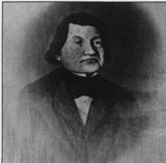
Michel Bibaud, auteur de L'histoire du Canada et des Canadiens sous la domination anglaise, publiée chez Lovell & Gipsion au XIX ème siècle.

Si la population a du mal à distinguer les intérêts du gouvernement de ceux de l'aristocratie, c'est que cette dernière représente pour l'État un rouage essentiel du pouvoir local dans une société rurale. Cela est aussi vrai du Bas-Canada que de l'Angleterre. Les années 1837-1838 portent un dur coup à la sainte alliance de la couronne avec la gentry . Manifestement, on ne peut plus compter sur la gentry pour contenir les impul-