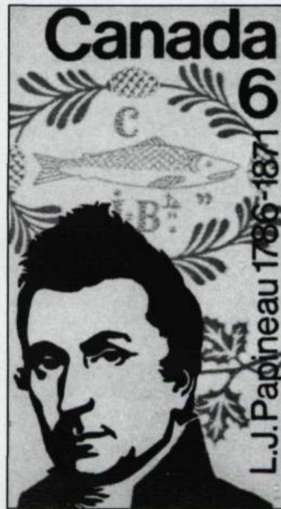
Timbre de 6 cents émis à l'occasion du centenaire de la mort de Louis-Joseph Papineau en 1971.

1838. Devant l'emblème du maskinongé qui figurait sur le drapeau des Patriotes de Saint-Eustache, un homme encore jeune,