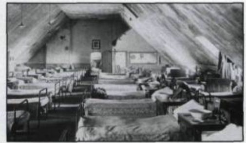
Le grand dortoir du Séminaire en 1912. Carte postale.

En 1958, je fus créé chanoine par Mgr Maurice Roy, lui aussi un aumônier militaire. J'ai accepté cette nomination comme un ordre. Benjamin du chapitre alors, j'en suis aujourd'hui le doyen.