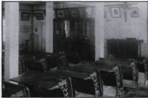
Une classe de Rétorique au Séminaire de Québec en 1912. Carte postale.

dîner chez eux. Nous avions alors le chapelet du Sacré-Coeur. À onze heures et vingt cinq, nous avions un très bon dîner même si le menu ne variait guère. Ceux qui se plaignaient n'avaient souvent guère mieux au domicile de leurs parents.