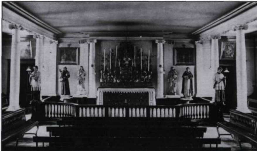
La chapelle de la Congrégation du Séminaire vers 1910. (Archives du Séminaire de Québec).

Après le dîner, nous avions une séance d'études entre une heure et quart et deux heures moins cinq. Nous entrions alors en classe jusqu'à quatre heures. À la sortie des classes, nous prenions chacun un petit pain dans une grande corbeille et nous descendions à la cour en passant par la tour des nord (toilettes). C'était le règlement! De quatre heures trente à six heures nous étudions nos leçons à la salle des études. C'est ce que nous appelions «l'heure et demie». Et cela se faisait dans le grand silence.