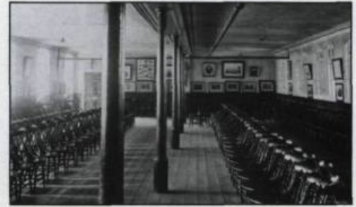
Parloir du Séminaire en 1912. Carte postale. (Archives du Séminaire de Québec).

Par la suite, je devins procureur du Séminaire et de l'Université. J'occupais ce poste lorsque ces deux institutions se séparèrent. J'administras sagement. Tout ce que je peux dire, c'est que le Séminaire n'a pas fait banqueroute.