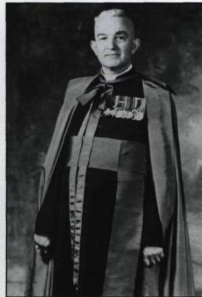
Trois moments importants de la carrière d'Émile Jobidon: jeune prêtre, aumônier militaire et chanoine. (Archives du Séminaire de Québec).

J e suis originaire de la capitale de la Côte de Beaupré, Château-Richer, et issu d'une famille d'agriculteurs.