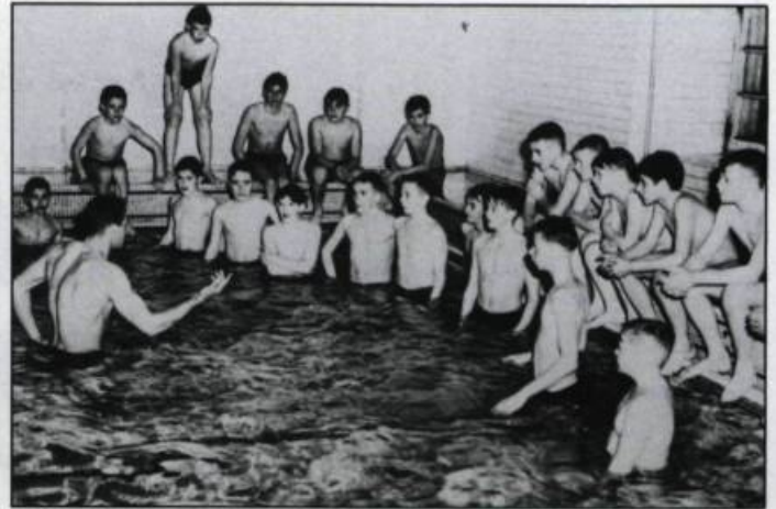
La piscine du Séminaire de Québec vers 1950. (Archives du Séminaire de Québec).

L'enseignement de l'anglais est aussi médiocre que peut l'être celui d'une langue étrangère enseignée par des indigènes, sans les moyens audiovisuels d'aujourd'hui et, au surplus, à des jeunes qui n'ont à peu près jamais l'occasion de l'utiliser. Un professeur d'anglais, philosophe de nature, en profite pour nous initier magistralement, à l'occasion, à la poésie de Shakespeare et de Keats.