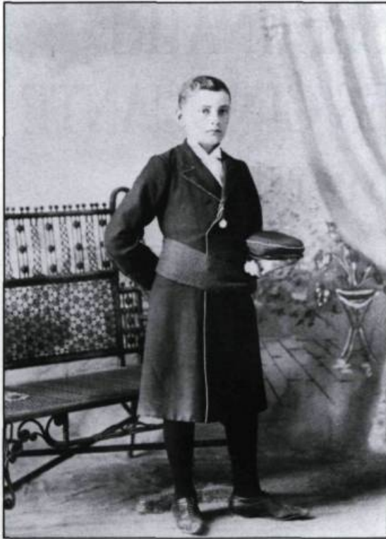
Le suisse, costume des étudiants du Petit Séminaire jusqu'en 1943. (Cliché du photographe A.-R. Roy en septembre 1897, Archives du Séminaire de Québec).

l'institution et dont les manières masquent souvent mal un manque d'assurance certain devant les «gars de la ville».